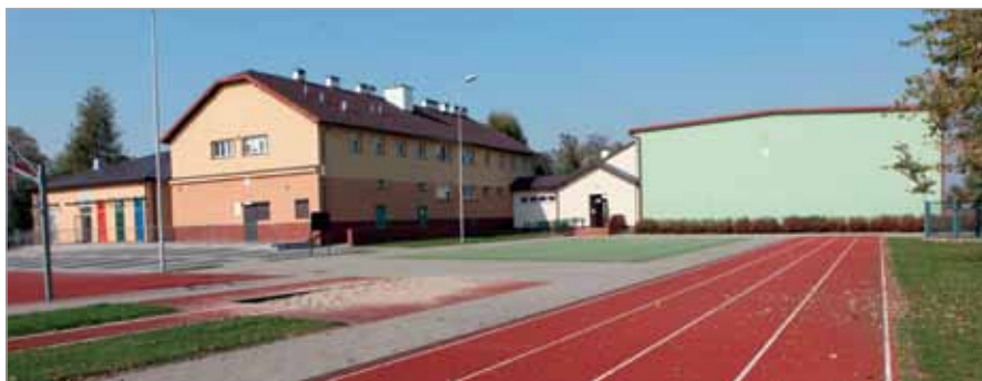
Obiekty sportowe i nowa szatnia przy ZSP w Borzęcinie Dużym

GOSiR na terenie Strefy Rekreacji Dziecięcej w Borzęcinie Dużym prowadzi zajęcia sportowo-rekreacyjne w ramach utrzymania rezultatów projektu „Promocja zdrowia w gminie Stare Babice poprzez stworzenie Strefy Rekreacji Dziecięcej”. Zajęcia prowadzone są od marca