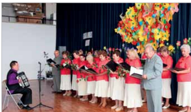
Zespół „Sami Swoi” podczas jubileuszu