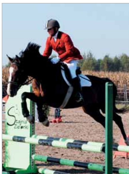
Konkursy skoków przez przeszkody budziły wiele emocji