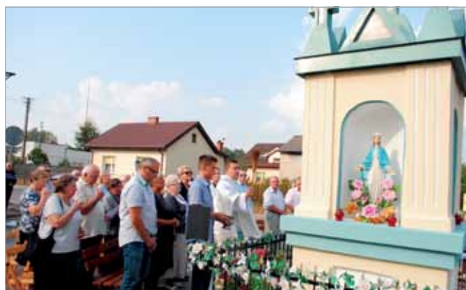
Podczas poświęcenia kapliczki w Mariewie obecni byli przedstawiciele władz gminy i powiatu