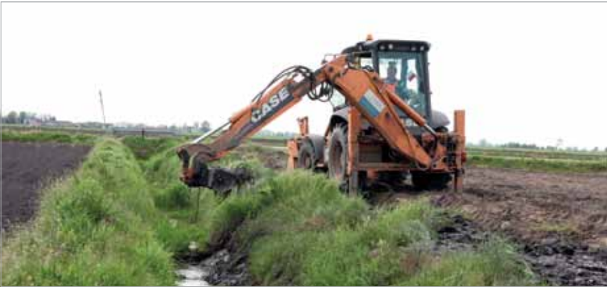
Powiatowa koparka podczas odmulania rowu w okolicach Borzęcina

powiatowe turnieje piłkarskie, a w tym roku piknik lotniczy – w 70. rocznicę bitwy pod Arnhem.