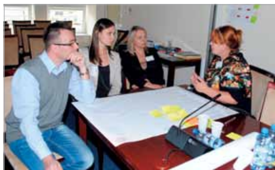
W podgrupach omawiano zagadnienia pracy z młodzieżą