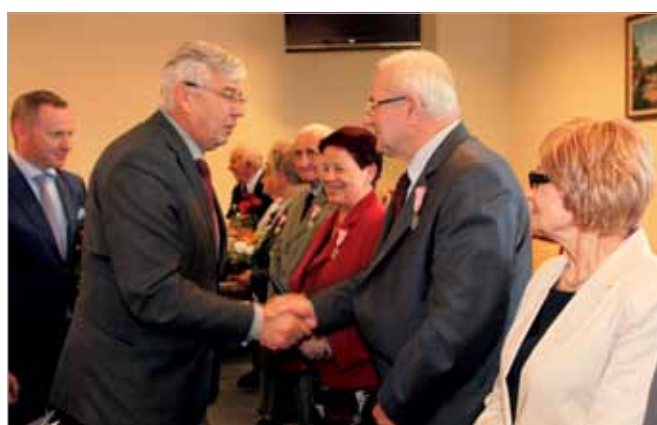
Medale od Prezydenta RP wręczał Wójt Gminy