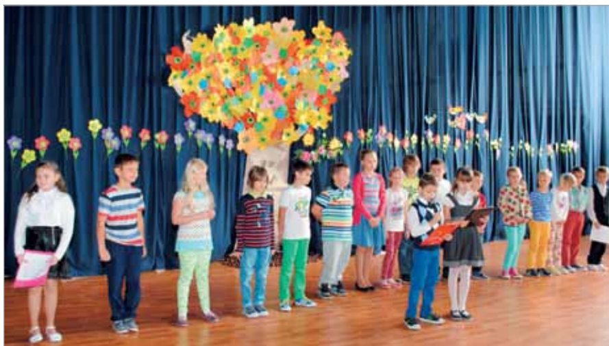
Występ dzieci z ZSP w Borzęcinie Dużym

14 października obchodziliśmy „święto oświaty i szkolnictwa wyższego”. Z tej okazji odwiedziliśmy szkoły podstawowe w naszej gminie.