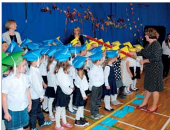
Pasowanie i ślubowanie uczniów w szkole podstawowej w Starych Babicach