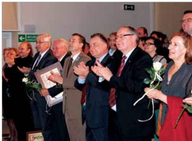
Występy artysty budziły duże uznanie publiczności