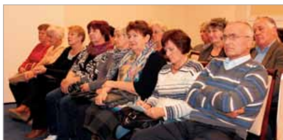
Wykład inauguracyjny wzbudził duże zainteresowanie publiczności