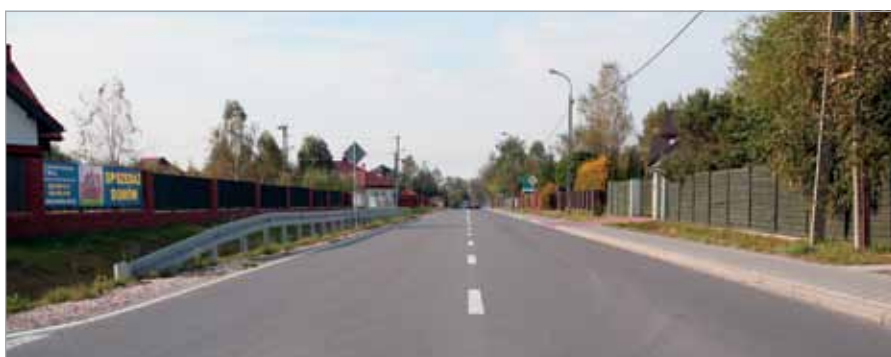
Ul. Mościckiego – efekt dobrej współpracy Gminy i Powiatu

Powiat idealnie nadaje się do łączenia różnych inicjatyw. Patronatem Starosty można wspomagać lokalne działania. Tak właśnie czynimy. Od 10 lat wspólnie organizujemy festiwal muzyczny „W Krainie Chopina”, od wielu lat Eko-Piknik w Kampinosie, od 4 lat – Półmaraton im. Janusza Kusocińskiego, liczne rajdy rowerowe, biegi o Puchar Starosty,