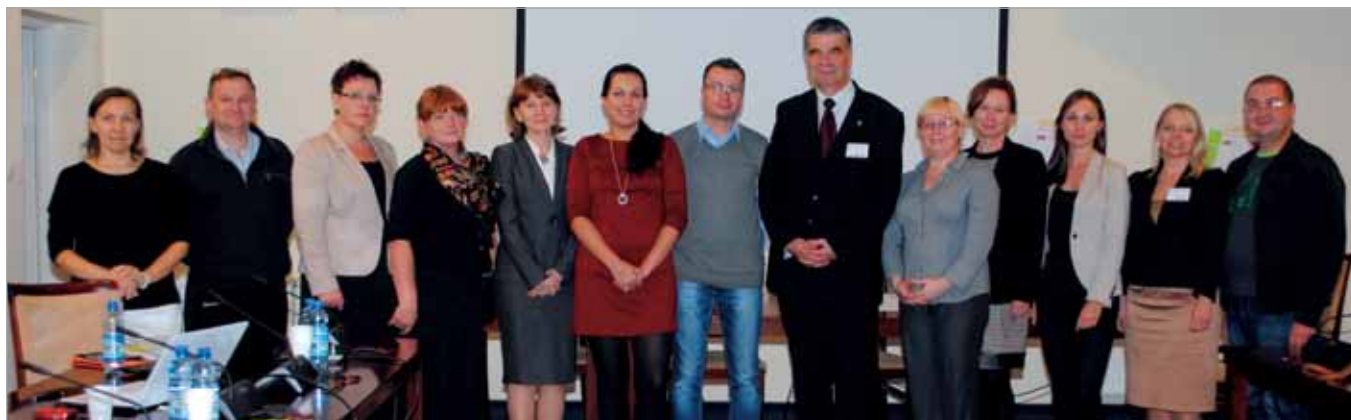
Uczestnicy II Forum Lokalnego

z miast i wsi. Na ich tle analizowała naszą babicką młodzież oraz zasoby lokalnego środowiska, w myśl hasła Forum – jak te zasoby właściwie wykorzystywać, by młodzież miała łatwiejszy start w dorosłe życie.