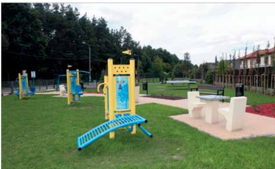
Siłownia w Latchorzewie

Dużym zainteresowaniem mieszkańców cieszy się siłownia na wolnym powietrzu. Ostatnio taki obiekt otworzyliśmy przy ul. mjr. H. Dobrzańskiego „Hubala”, kolejna siłownia powstanie w babickim parku przy ul. H. Sienkiewicza.