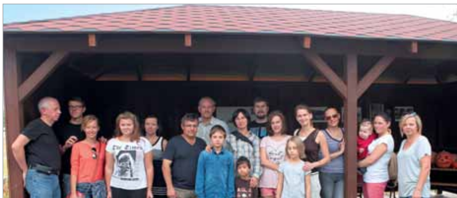
Nowa altana w Latchorzewie zgromadziła wielu gości

20 września w Latchorzewie odbyło się uroczyste otwarcie nowej altany stojącej w pobliżu ul. Szeligowskiej.