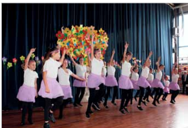
Występ grupy tanecznej z Borzęcina Dużego