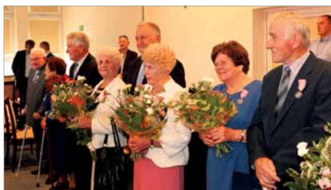
Kwiaty dla jubilatów

Rozmowy jubilatów z przedstawicielami Gminy toczyły się później przy stole ze słodkim poczęstunkiem. Nie zabrakło również kwiatów i jubileuszowych upominków. Serdecznie Gratulujemy Wszystkim Uhonorowanym Parom!