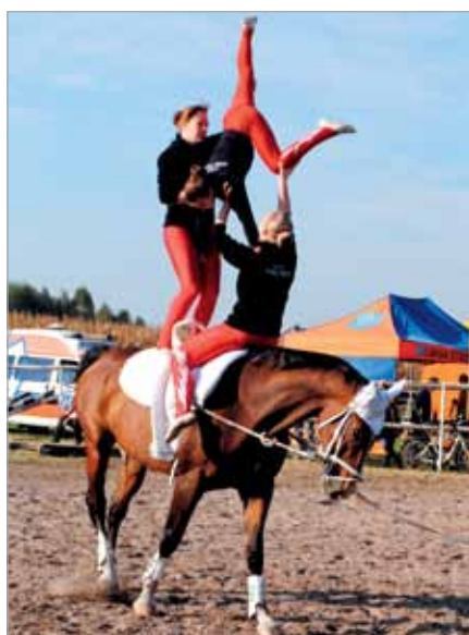
Pokaz woltyżerki w wykonaniu UKS Volteo

Specyfiką KSJ jest zawsze bogata oferta atrakcji dla publiczności. Tak było i tym razem. Oprócz sportowej rywalizacji widzowie obejrzeni pokaz woltyżerki w wykonaniu grupy UKS Volteo. Na najmłodszych czekały także ciekawe zabawy, stoisko z robotami i gra „Jeździectwo w szerszym wymiarze”, przybliżająca wiedzę o tej dyscyplinie.