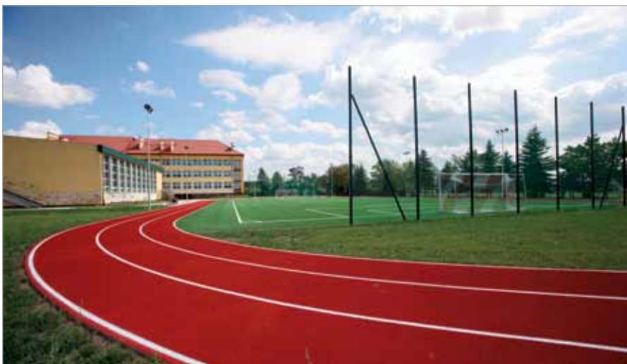
Bieżnia lekkoatletyczna i boiska przy szkole podstawowej w Starych Babicach

– Dążymy do wcielenia w życie idei babickich ogrodów. W różnych miejscowościach gminy pojawiają się przestrzenie zielone przeznaczone do rekreacji i wypoczynku. W tym roku w gminie posadziliśmy ponad 220 drzew, w tym wiele przy babickim Rynku. Zagospodarowaliśmy otoczenie stawów i oczek wodnych, m.in. w Latchorzewie, na Placu Chopina w Borzęcinie i Bliznem Jasińskiego. Nowe ławki i oświetlenie pojawiły się także w miejscowości Zielonki Parcele na Polanie Dwóch Stawów. Warto zauważyć również nowe boisko trawiaste w Wojcieszynie, wkrótce powstanie tam także plac zabaw. Wiele takich miejsc powstało na terenie gminy w poprzednich latach, są chętnie odwiedzane przez najmłodszych.