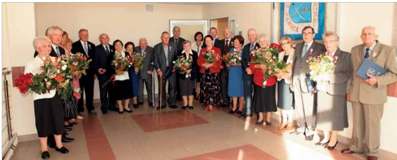
W październiku uhonorowano 11 zasłużonych par

9 października w sali konferencyjnej Urzędu Gminy uhonorowano 11 par medalami „Za Długoletnie Pożycie Małżeńskie”, nadanymi przez Prezydenta RP Bronisława Komorowskiego.