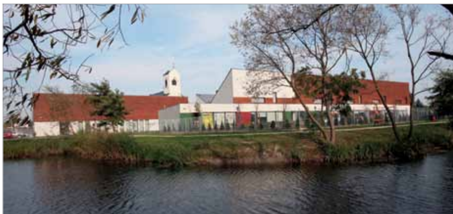
Przedszkole w Bliznem Jasińskiego

Bardzo dużą wagę Gmina przywiązuje do oświetlenia ulic i systematycznie,