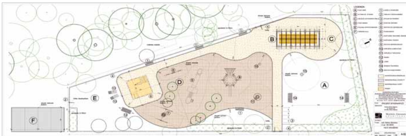
Projekt placu zabaw, który powstanie w Klaudynie

Rozmawiano także o tragedii, do której doszło w Klaudynie i możliwościach pomocy pogorzelcom. MF