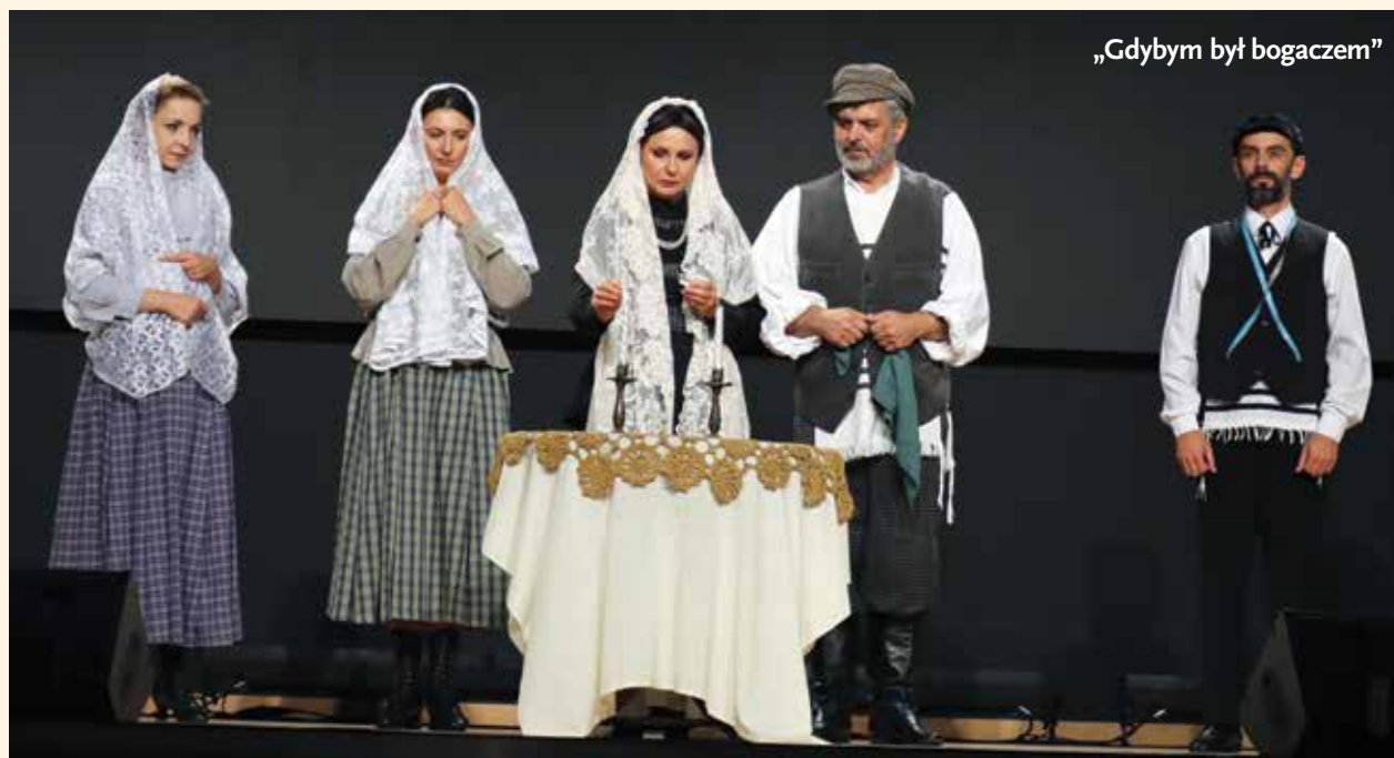
„Gdybym był bogaczem”