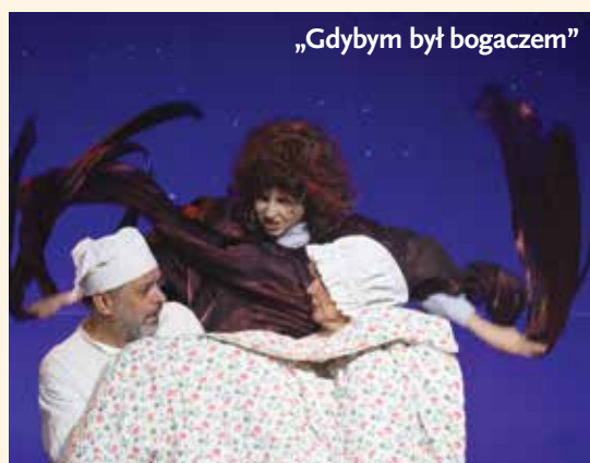
„Gdybym był bogaczem”