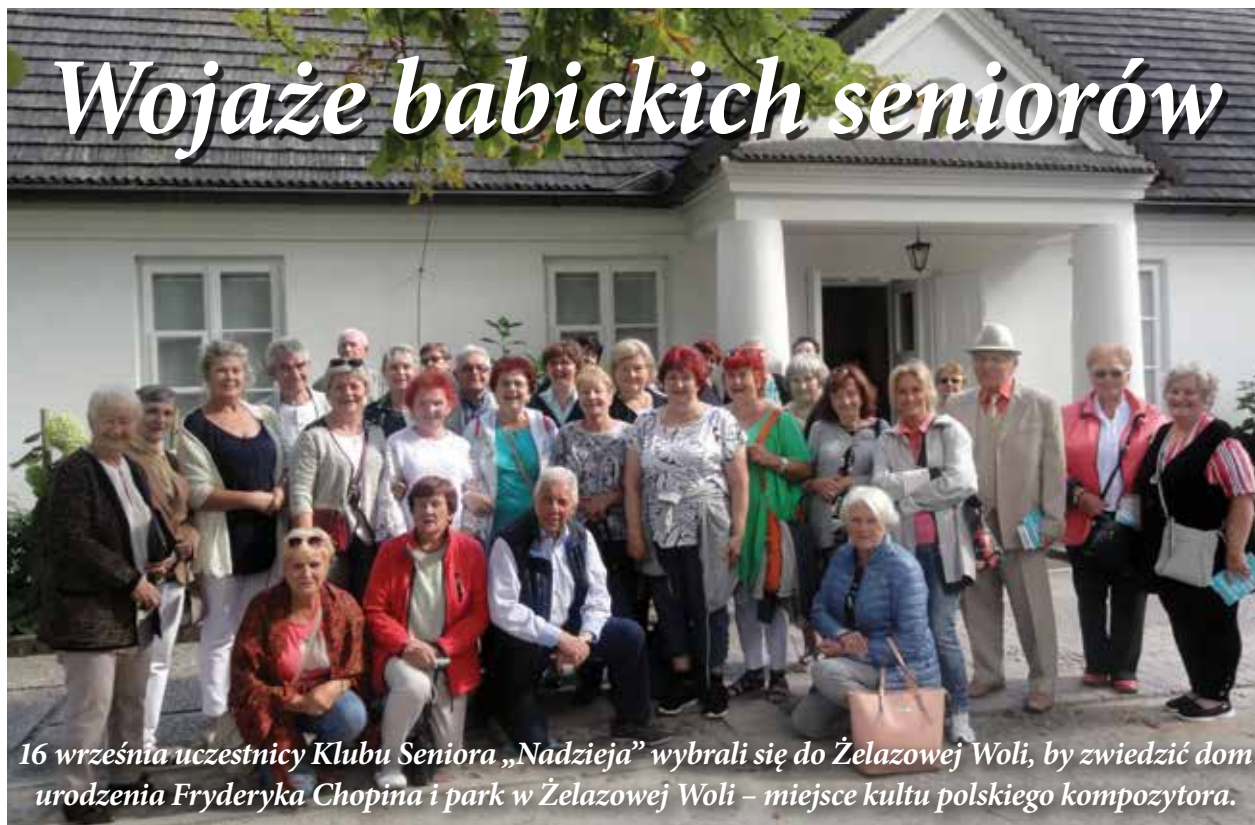
16 września uczestnicy Klubu Seniora „Nadzieja” wybrali się do Żelazowej Woli, by zwiedzić dom urodzenia Fryderyka Chopina i park w Żelazowej Woli – miejsce kultu polskiego kompozytora.