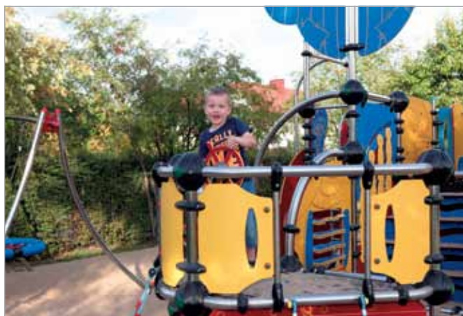
Doposażony plac zabaw w Starych Babicach

Gmina przejęła na czas budowy w zarząd ul. Kosmowską w Borzęcinie Dużym. Zakończono tam budowę kanalizacji i aktualnie trwają tam intensywne prace przy budowie drogi. Realizowany jest I etap inwestycji- remont jezdni z krawężnikami, budowa poboczy i rowów. Wartość tych prac wynosi 4,4 mln zł. Remontowany odcinek liczy około 2.3 km. W drugim etapie inwestycji wybudowane zostaną chodniki i docelowe wjazdy na posesje. Zakończenie prac przy budowie nawierzchni i po podpis