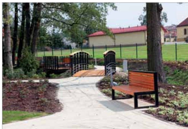
Park gminny w Starych Babicach