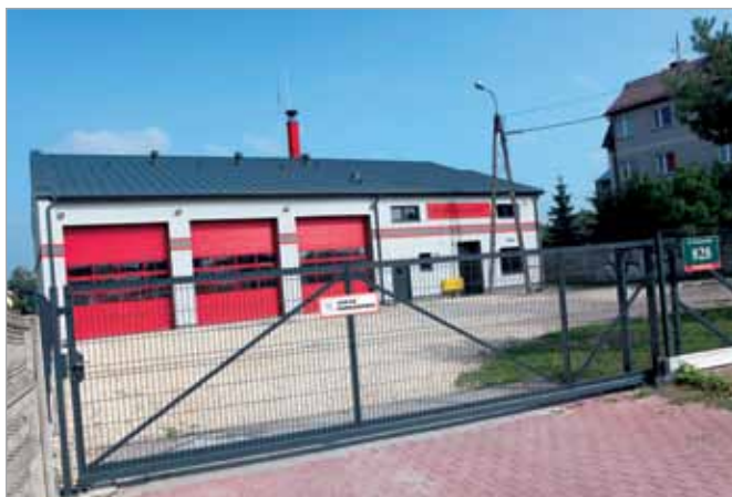
Rozbudowywana remiza w Borzęcinie Dużym