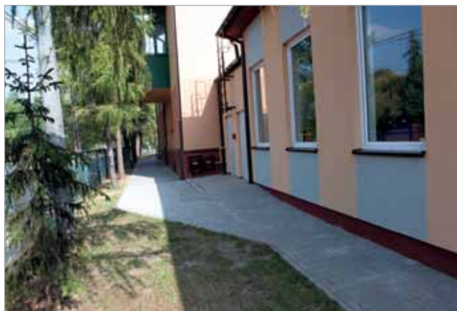
Nowy chodnik przy ZSP w Borzęcinie Dużym