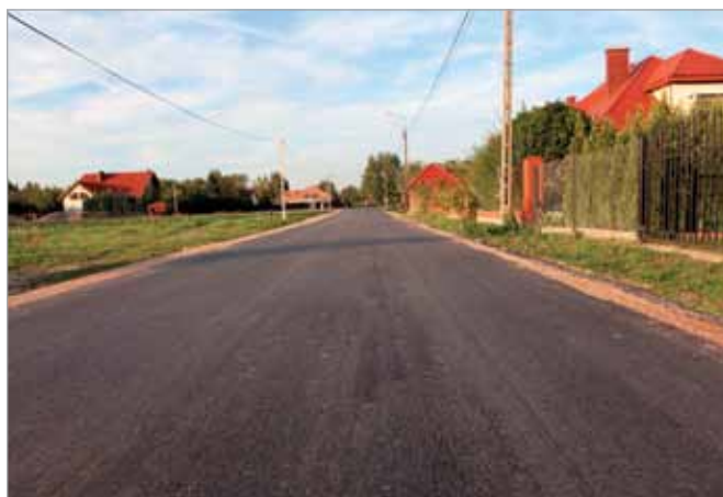
Nowa nawierzchnia na ul. Johana Straussa

łożenie asfaltu zaplanowano do końca października br. Zakończenie całości budowy I etapu inwestycji z pobocznymi i peronami autobusowymi - do 15 grudnia br. Termin realizacji II etapu budowy uzależniony jest od tempa wykupu gruntów pod chodniki prowadzonego przez Powiat.