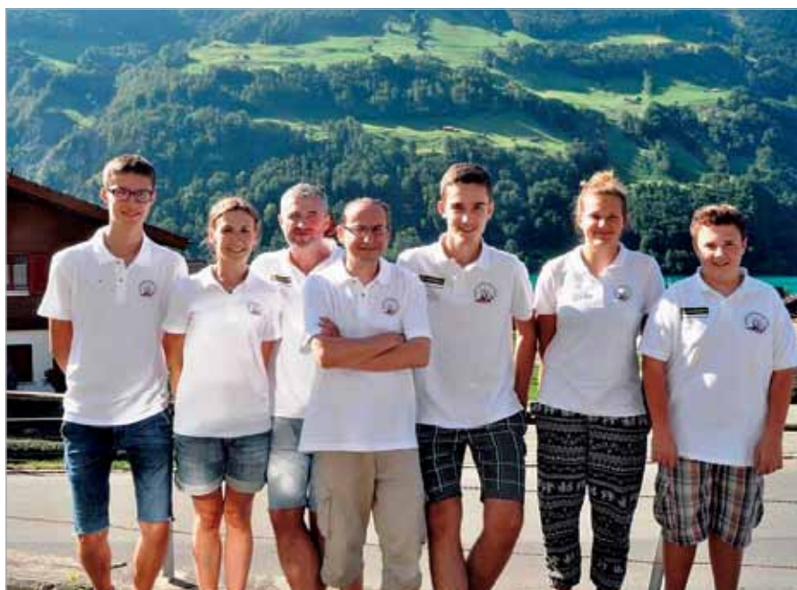
Drużyna Carrom z Polski