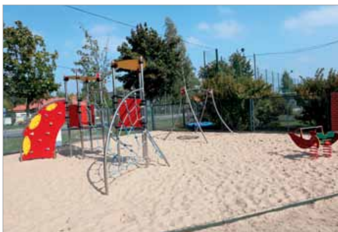
Nowy plac zabaw w Borzęcinie Dużym