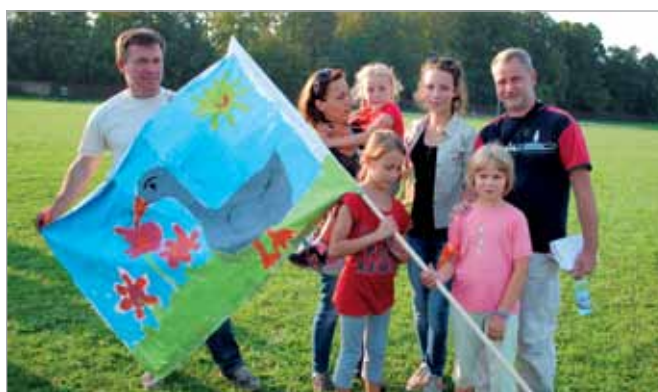
Gra terenowa Stowarzyszenia Odkrywamy Świat integrowała całe rodziny