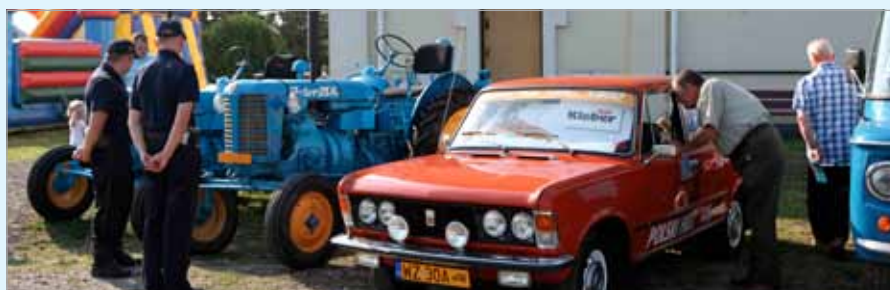
Wystawa pojazdów zabytkowych w Bliznem Jasińskiego

Przy okazji jubileuszu warto docenić zmiany, jakie zachodzą w Bliznem Jasińskim: pięknie zagospodarowany skwer wokół stawu i przedszkola, boisko i tereny sportowe, przy których powstało miejsce do gry w koszykówkę. Przekształcenia będą trwały nadal, np. teren pomiędzy ulicami: Piotra Skargi, mjr. Dobrzańskiego „Hubala”, Łaszczyńskiego i Kościuszki ulegnie procesowi scalenia.