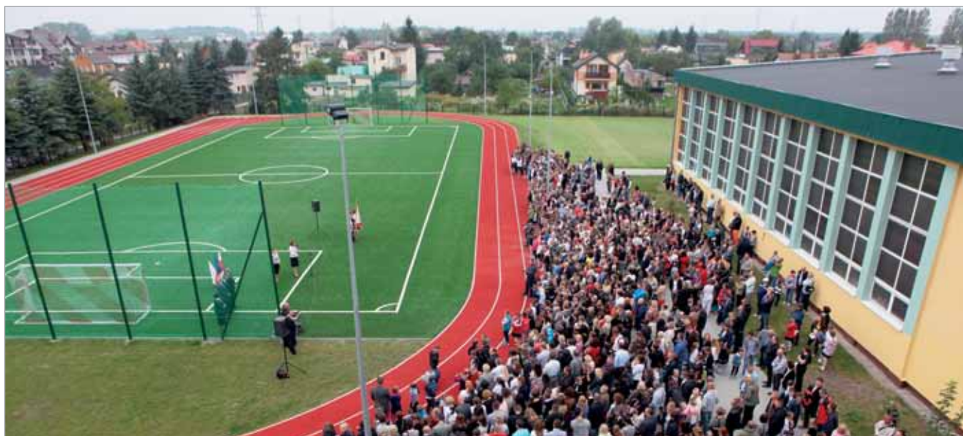
Początek roku na nowym boisku w Starych Babicach