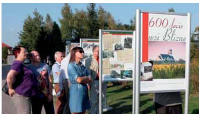
Wystawa przedstawiała Blizne wczoraj i dziś