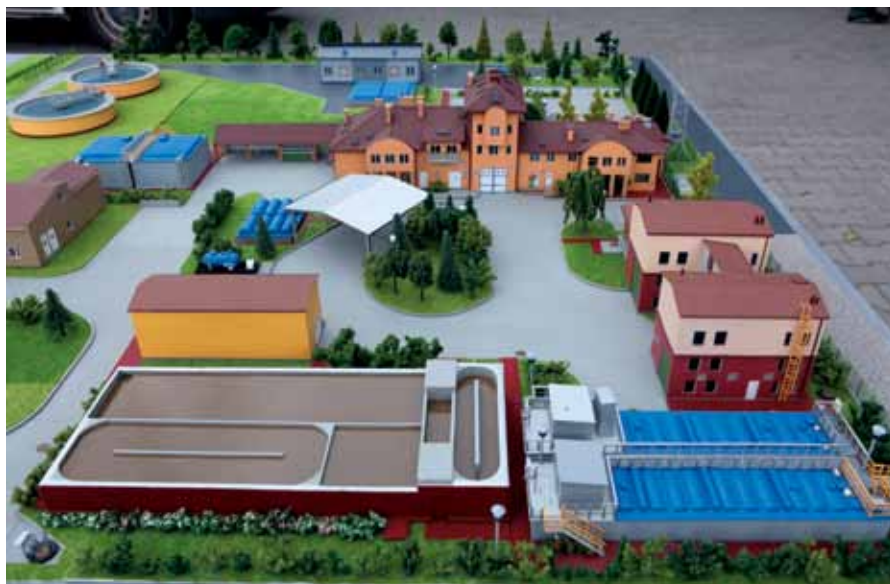
Makieta przedstawia wygląd Oczyszczalni Ścieków w Starych Babicach po rozbudowie i modernizacji

TEKST: PAWEŁ TURKOT PREZES ZARZĄDU EKO-BABICE KOREKTA: KIEROWNIK J.R.P. PAWEŁ BOHDZIEWICZ MAPKA: KRZYSZTOF LEBIEDOWICZ KOORDYNATOR J.R.P.