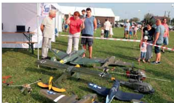
Wystawę modeli zaprezentowało Lotnisko Koczargi