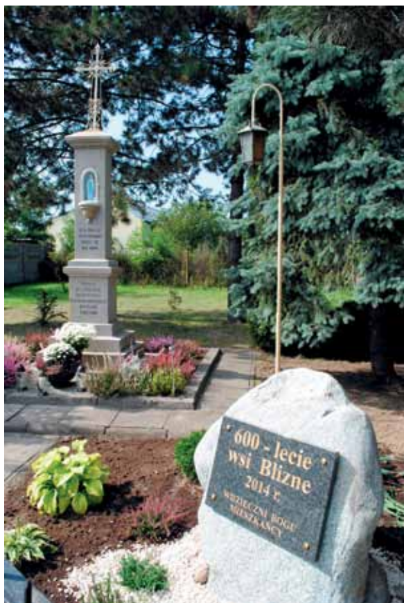
Podczas obchodów 600-lecia Bliznego poświęcono pamiątkowy kamień. Więcej o Jubileuszu – czyt. str. 10

Z RADNYM LESZKIEM POBORCZYKIEM ROZMAWIAŁ MARCIN ŁADA