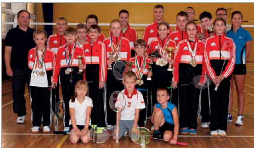
Mistrzowska drużyna z trenerem i Prezesem UKS Badminton Stare Babice