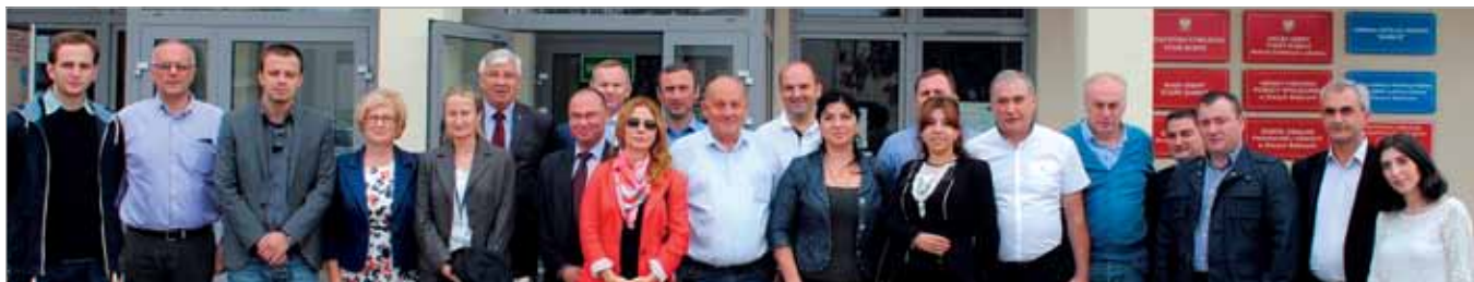
Pamiątkowe zdjęcie delegacji z Gruzji z władzami babickiej gminy