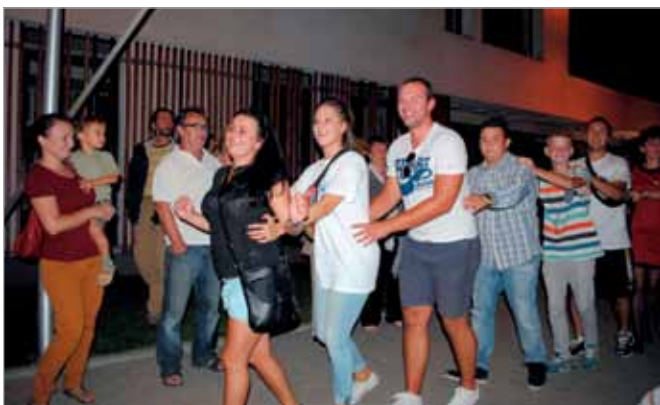
Zabawa trwała do późnego wieczora, nie zabrakło przysmaków i dobrej muzyki