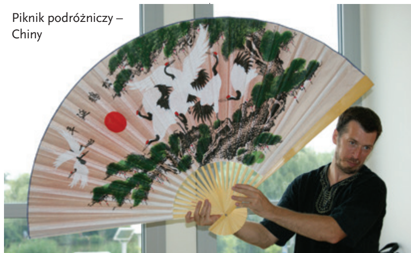
Piknik podróżniczy – Chiny

odbyliśmy podróż przez trzy kontynenty. Byliśmy w Afryce, Azji i Ameryce Południowej. Można było posmakować marokańskiej herbaty, dotknąć piasku z Sahary, zagrać na