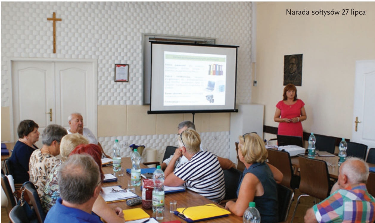
Narada sołtysów 27 lipca