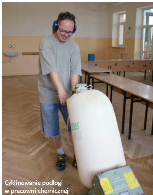
Cyklinowanie podłogi w pracowni chemicznej