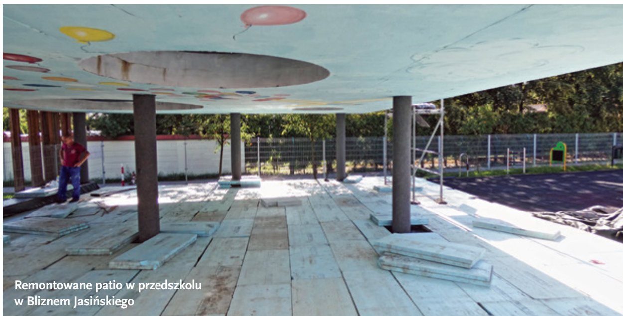
Remontowane patio w przedszkolu w Bliznem Jasińskiego

zaplanowano także środki w wysokości 70 000 zł na dokumentację techniczną przebudowy szatni wraz z wizualizacją. Dokumentacja została wykonana, a kosztorys wynosi około 1 mln zł. Planujemy tę inwestycję wykonać w roku 2019. Chciałbym przypomnieć, że przez ostatnie dziewięć lat z budżetu gminy na remonty boisk, łazienek, stołówki, kotłowni, dachu, hali sportowej, sal informatycznych itd. w starobabickiej podstawówce wydaliśmy blisko 10 mln zł – czyli najwięcej ze wszystkich gminnych placówek oświatowych.