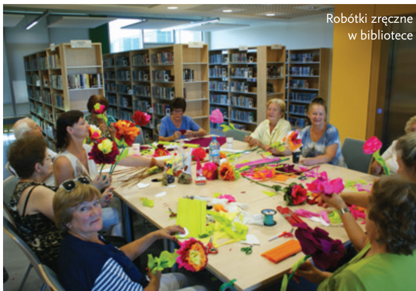
Robótki zręczne w bibliotece

może zgłosić tylko jedną propozycję nazwy. Warunkiem uczestnictwa w konkursie jest przesłanie zgłoszenia poprzez formularz elektroniczny dostępny na stronie biblioteki do 11. 09. 2018 r. do północy. Za dziecko zgłoszenia powinien dokonać prawny opiekun. Spośród wszystkich nadesłanych propozycji jury powołane przez organizatora konkursu wybierze najciekawszą nazwę. Dla zwycięzców przewidziane są nagrody: główna w postaci tabletu, pozosta-