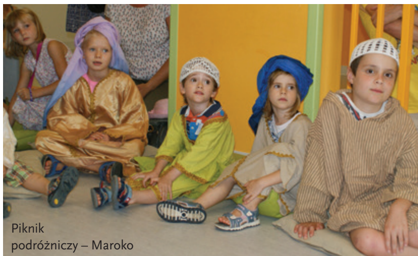
Piknik podróżniczy – Maroko

oryginalnych marokańskich instrumentach. W drugiej części podróży przenieśliśmy się do Chin – tu nauczyliśmy się kilku zwrotów w tym oryginalnym i obco brzmiącym języku; dowiedzieliśmy się, jakie używane dzisiaj przez nas rzeczy wymyślili Chińczycy; spróbowaliśmy operować oryginalnymi pałeczkami; przymierzaliśmy chińskie tradycyjne stroje. Trzecia podróż pozwoliła nam dowiedzieć się, jak dzisiaj wygląda życie Indian, zmierzyć indiańskie stroje – ruany, poncha i kapelusze; zagrać na indiańskich instrumentach; zdobyć zmywalny indiański tatuaż odciskany prekolumbijską pieczęcią. Uffff!!! Ależ się działo!