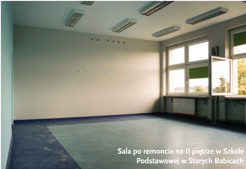
Sala po remoncie na II piętrze w Szkole Podstawowej w Starych Babicach

GB: A co zmieniło się w Zespole Szkolno-Przedszkolnym w Borzęcinie Dużym?