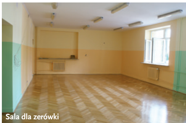
Sala dla zerówki