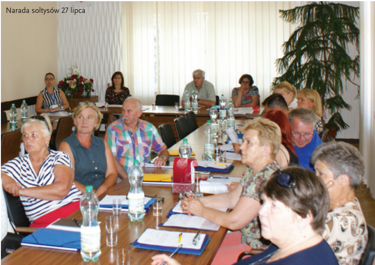
Narada sołtysów 27 lipca

teczności publicznej w sołectwie, np. remont placów zabaw, doposażenie ich w urządzenia;