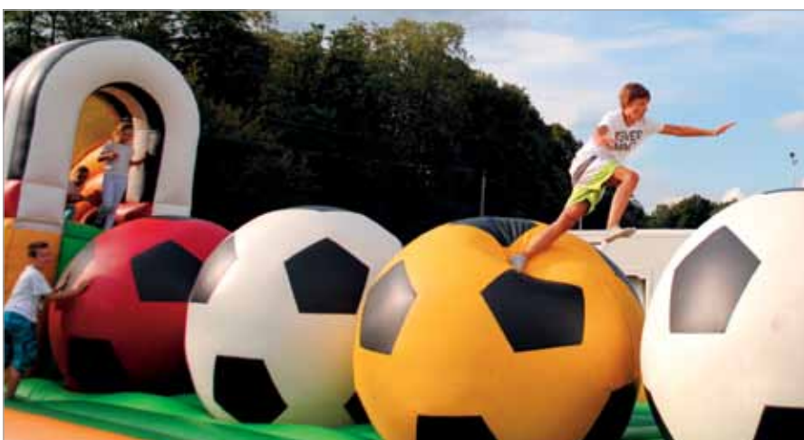
Konkurencje sprawnościowe cieszyły się dużym powodzeniem