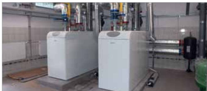
Nowe piece c.o. w SP w Starych Babicach, wymieniono także grzejniki