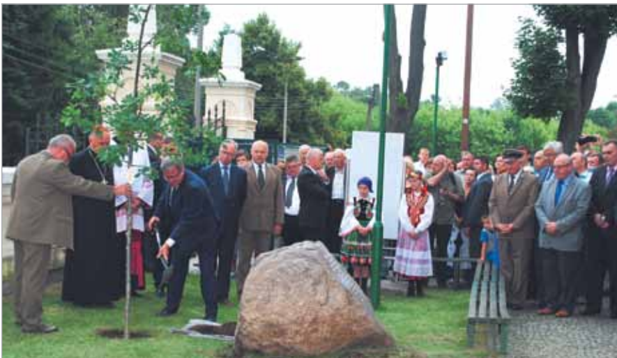
Prezydent RP Bronisław Komorowski zasadził Dąb Wolności w Zaborowie