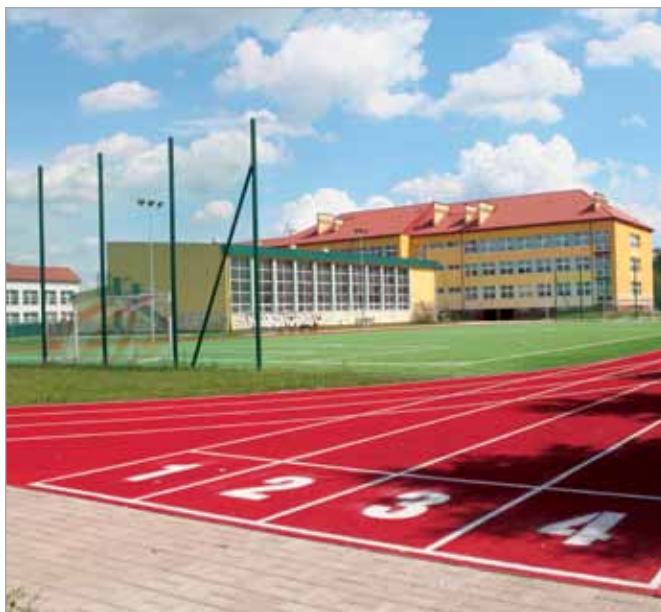
Bieżnia lekkoatletyczna przy szkole podstawowej w Starych Babicach