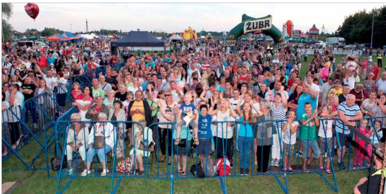
Babicki festyn cieszył się jak zwykle dużym zainteresowaniem

Festyn miał ponadto charakter dobroczynny – w trakcie imprezy odbyło się kilka akcji charytatywnych.