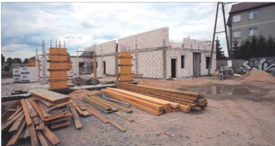
Budowa remizy OSP w Borzęcinie Dużym