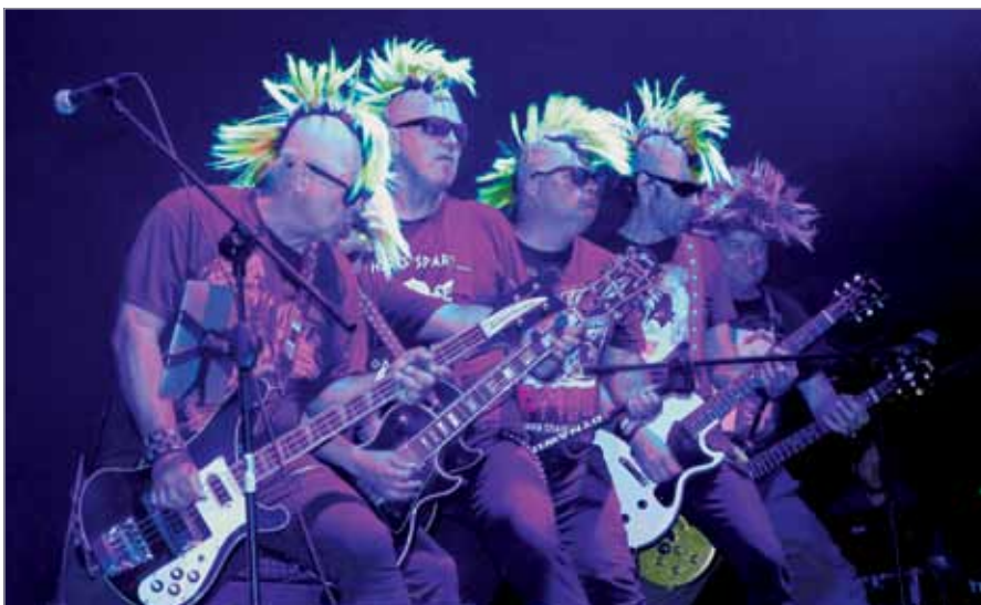
Gwiazda wieczoru – zespół „Big Cyc”