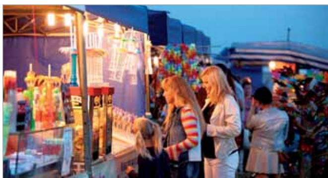
Kramiki z różnościami działały do późnego wieczora