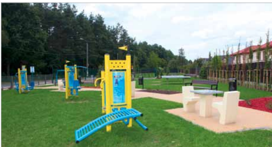
Siłownia plenerowa w Latchorzewie (więcej o tym obiekcie w następnym numerze „GB”)