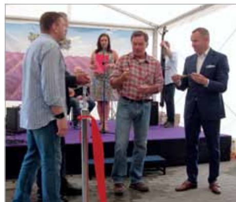
Chwilę po przecięciu wstęgi