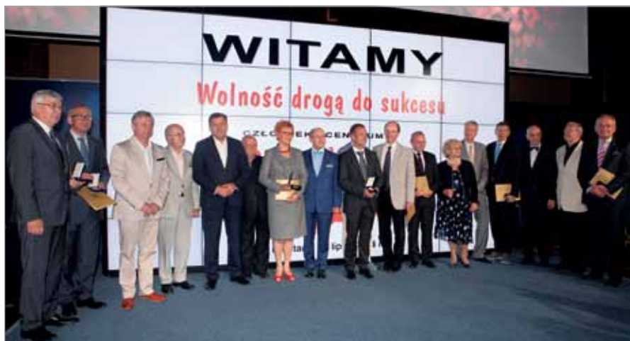
Laureaci Złotego Medalu APS z organizatorami i gośćmi honorowymi gali