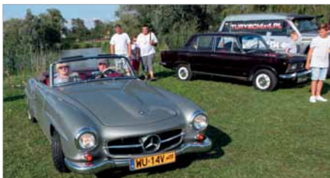
Imprezie towarzyszył II Zlot Pojazdów Zabytkowych