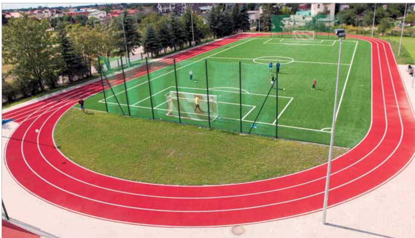
Babicki stadion z lotu ptaka

chorzewie, umocniono i wyremontowano przepusty pod drogami (przyczółki) m.in. na ul. Bugaj i Wiosennej w Koczargach Nowych. W Zielonkach Wsi na ul. Sportowej wykonano przepusty pod planowane w przyszłości drogi.