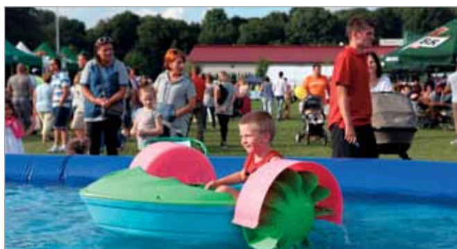
Na festynie nie zabrakło również wodnych konkurencji