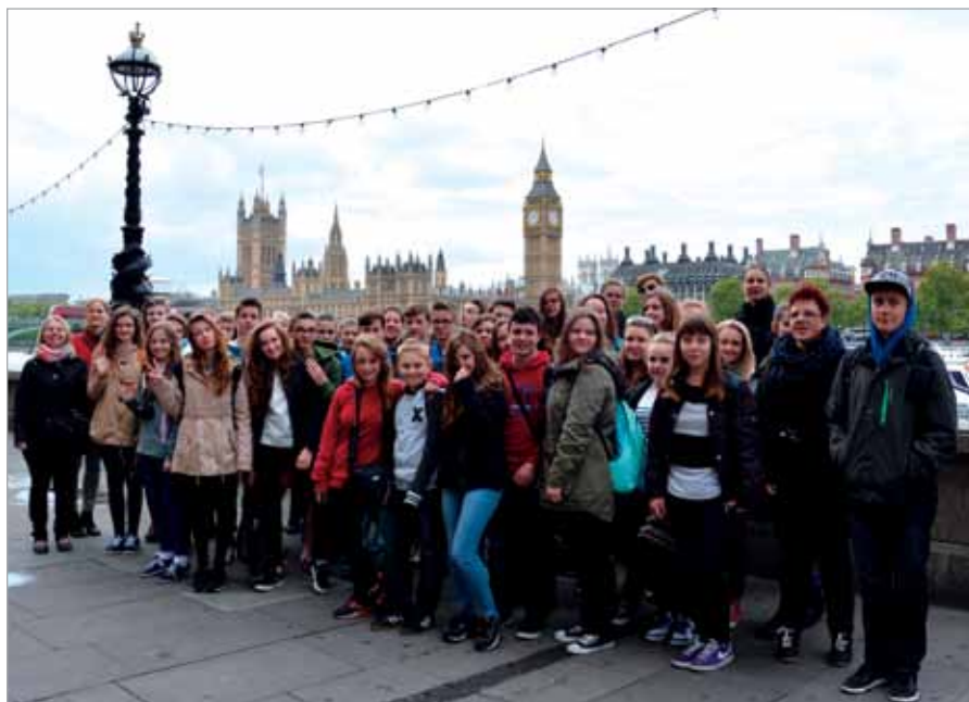
Przed wakacjami uczniowie z I Gimnazjum w Koczargach Starych odbyli językową podróż do Londynu. Mieszkali u angielskich rodzin, zwiedzali zabytki i ośrodki kultury

uczyć się o 40 osób więcej niż w roku poprzednim. Od września w gimnazjum uruchomionych zostanie 6 klas pierwszych, w tym 2 profilowane.