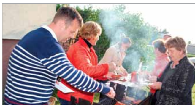
MŁ, FOT. KM