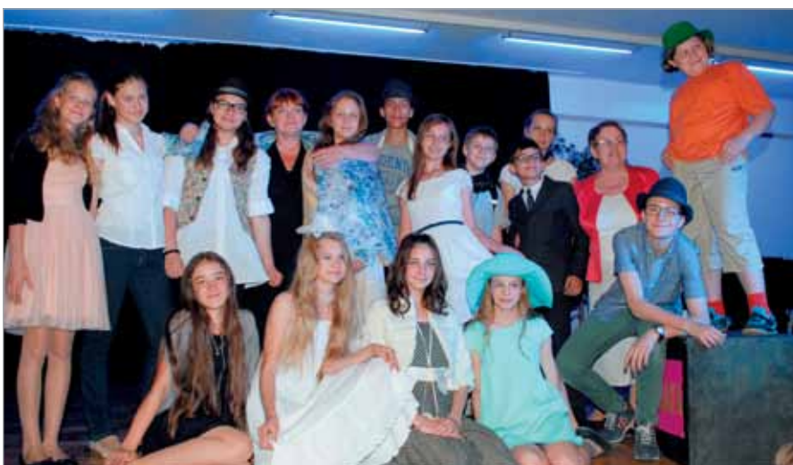
Wspólne zdjęcie uczestników „Galimatiasu”