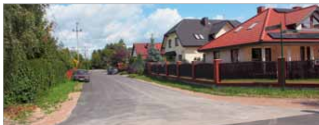
Nowa nawierzchnia asfaltowa w Kwirynowie