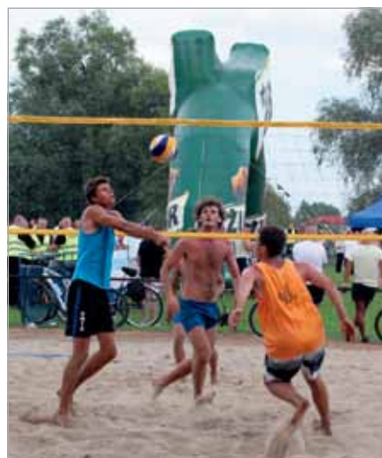
Turniej siatkówki plażowej – omówimy w następnym numerze