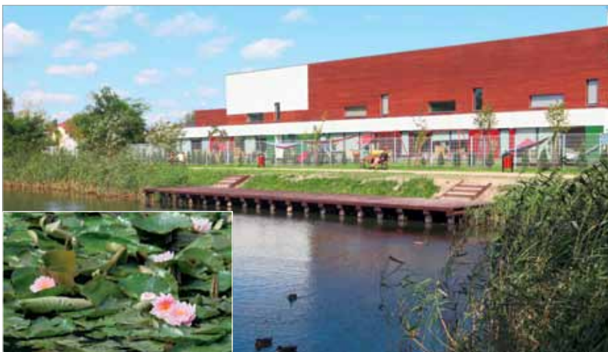
Pomost dla wędkarzy w Bliznem Jasińskiego i babickie nenufary

Trwają również prace gminne dotyczące odwodnienia dróg i okolicznych terenów. W ostatnim czasie wykonano odwodnienie ul. Warszawskiej w Lat-