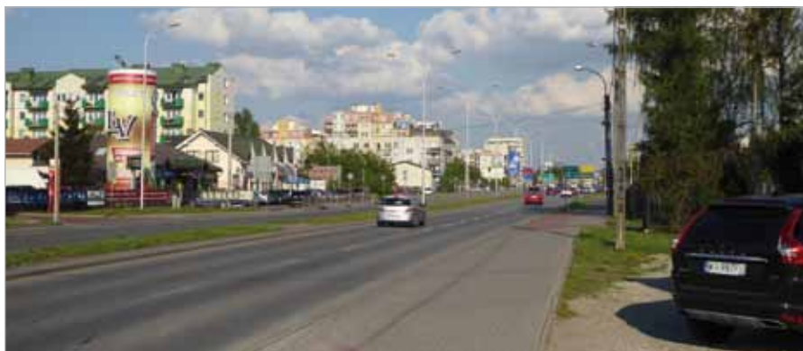
Wjazd z ul. Gościnnej na ul. Górczewską

Alicja Szelenbaum: Moja działka ma oznaczenie MN1/U2, co oznacza, że może być przeznaczona zarówno na