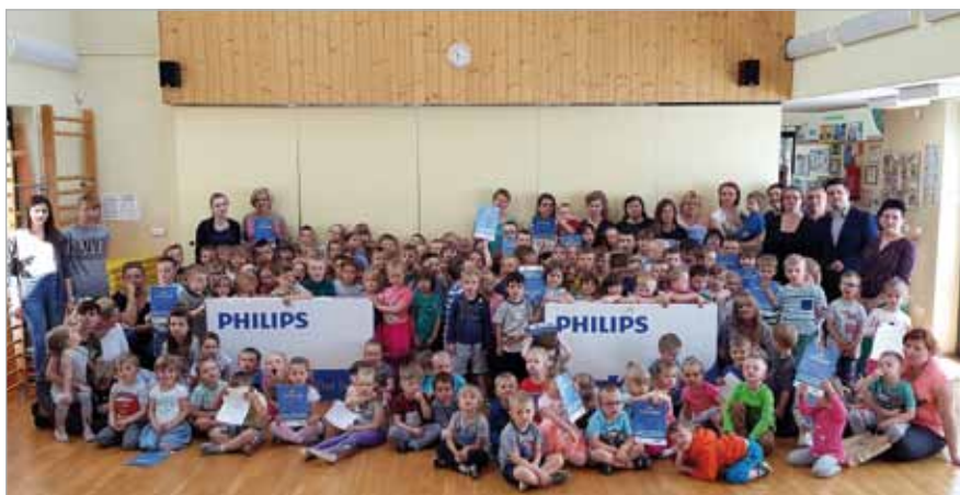
Laureaci z przedszkola w Bliznem Jasińskiego