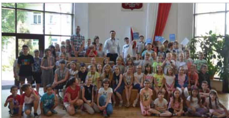
Laureaci ze szkoły w Koczargach Starych

W konkursowej akcji zbiórki surowców wtórnych uczestniczyło siedem publicznych placówek oświatowych: Szkoła Podstawowa w Koczargach Starych, Szkoła Podstawowa w Zespole Szkolno-Przedszkolnym w Borzęcinie Dużym, Szkoła Podstawowa w Zielonkach-Parceli, Szkoła Podstawowa im. H. Sienkiewicza w Starych Babicach, Przedszkole w Zespole Szkolno-Przedszkolnym w Borzęcinie Dużym, Przedszkole w Bliznem Jasińskiego oraz Przedszkole w Starych Babicach.