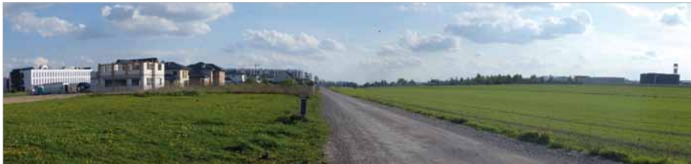
Ul. Gościnniej widok w kierunku południowym

TEKST: JP/MARCIN PAPIŃSKI