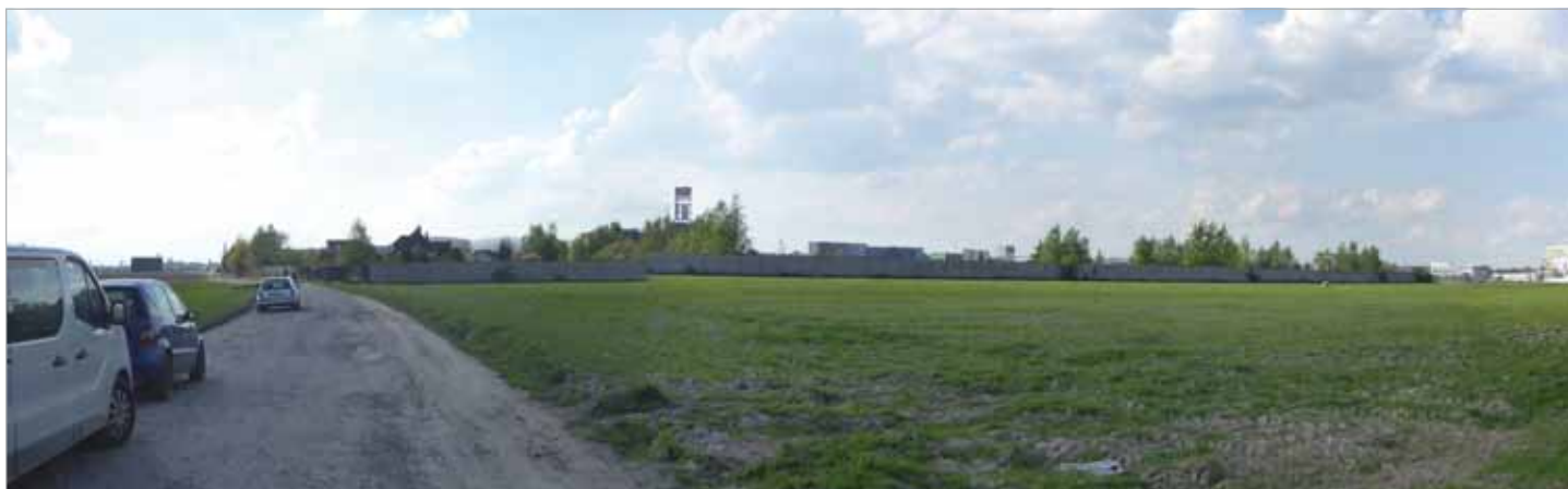
Ul. Batalionów Chłopskich przy południowej części terenu