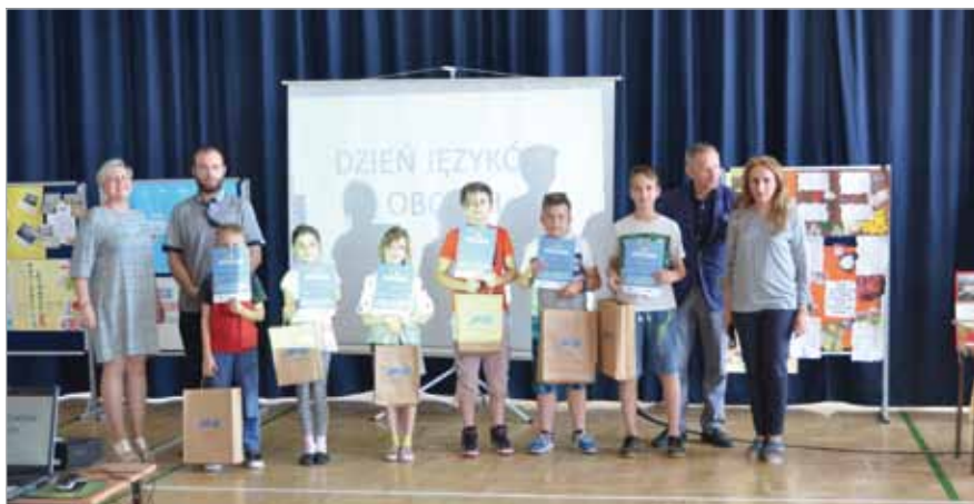
Laureaci z Borzęcina Dużego