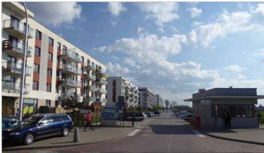
Droga wewnętrzna na przedłużeniu ul. Gościnniej

Piotr Dąbrowski: W 100% popieram plany inwestycyjne, ponieważ z perspektywy biznesowej te tereny doskonale na-