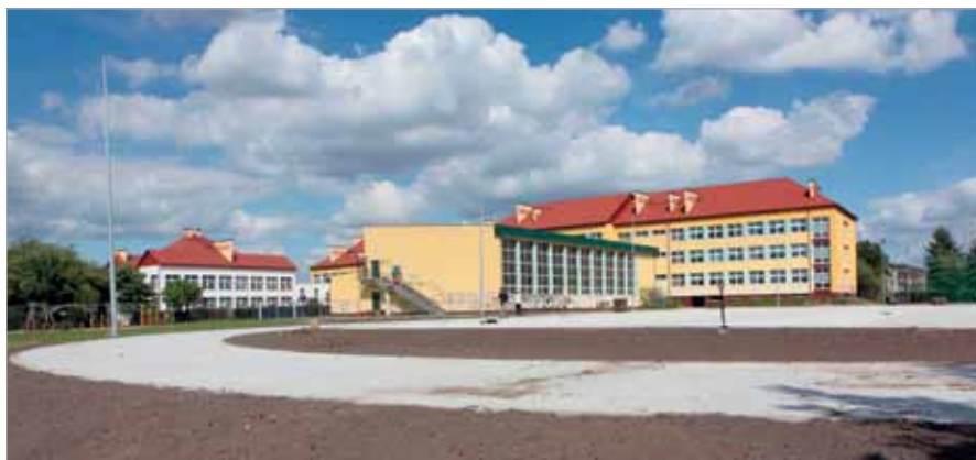
Zarys „babickiego stadioniku” przy szkole są już widoczne

Trwają intensywne prace przy budowie szatni wraz z zapleczem sanitarnym dla osób korzystających z boisk Strefy Rekreacji Dziecięcej i dla szkoły podstawowej w Borzęcinie Dużym. Aktualnie montowane są glazury i terakoty. Przy okazji prac budowlanych wyremontowano małą salę sportową w szkole. Prace powinny zakończyć się we wrześniu br., tak aby dzieci od nowego roku szkolnego mogły korzystać z tego obiektu. Koszt inwestycji wynosi około 1,4 mln zł.