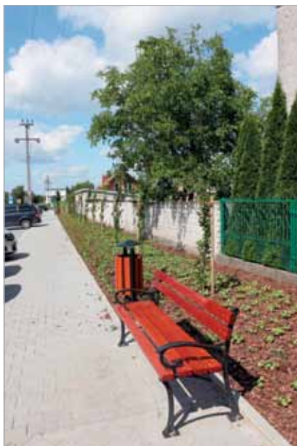
Aleja buków kolumnowych przy Urzędzie Gminy

Instalacje odwadniające projektowane są także m.in. w Koczargach Starych w ul. Orzechowej, natomiast w Zielonkach Parceli w ul. Zachodniej i w Kludynie.