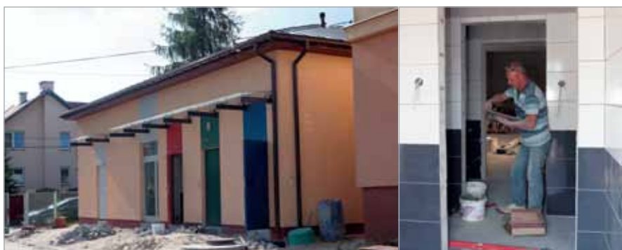
Trwają prace wykończeniowe w Borzęcinie Dużym