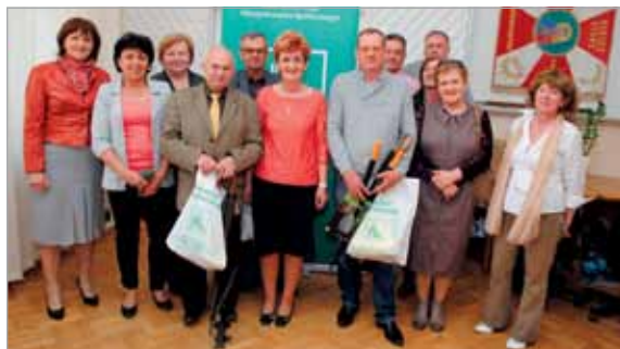
Uczestnicy i organizatorzy konkursu „Pracuj bezpiecznie”