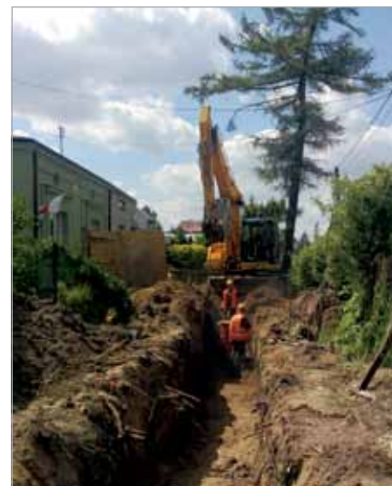
Zagęszczanie gruntu w Latchorzewie

O dalszym postępie prac i ewentualnych problemach realizacyjnych będziemy Państwa informowali w kolejnych arty-