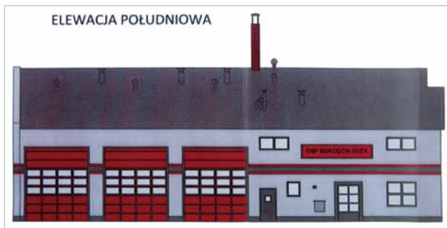
Widok remizy OSP Borzęcin Duży

nowej remizy wyniesie ok. 550 m 2 , na garaże wozów pożarniczych przeznaczony się ok. 250 m 2 . W remizie będą także: magazyny, zaplecze sanitarne, pokój biurowy i duża (ok. 100 m 2 ) sala do szkoleń strażaków, która powstanie w drugim, późniejszym etapie budowy tego obiektu. Koszt inwestycji wyniesie ponad 1 mln zł.