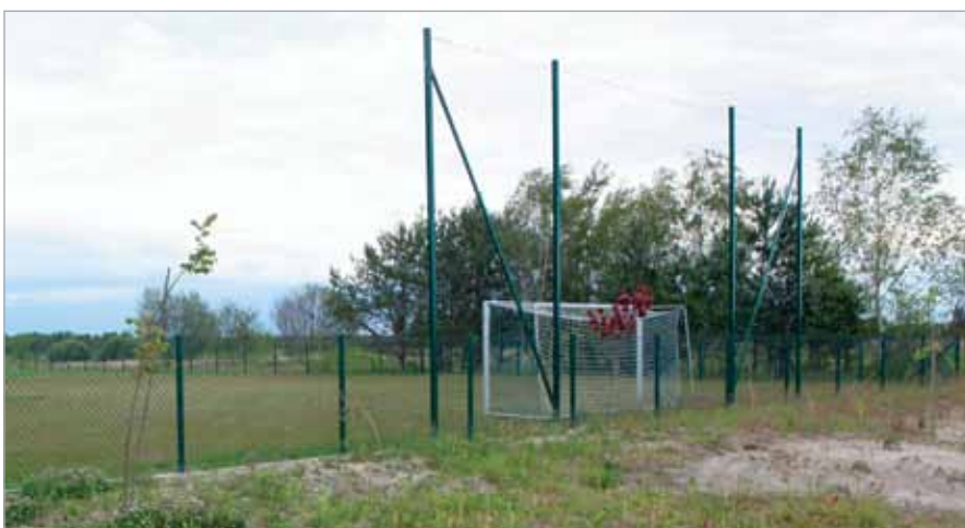
Plac do gry w piłkę nożną w Wojcieszynie

wego w Kwirynowie, odcinków ulic w Bliznem Łaszczczyńskiego, ul. Hetmańskiej w Lipkowie, ul. Agawy w Kwirynowie, ul. Ogrodniczej w Babicach Nowych, ul.