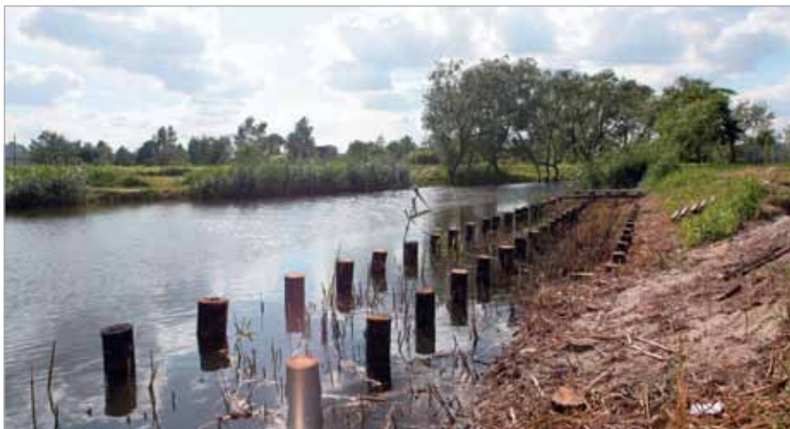
W Latchorzewie prawie jak nad morzem... Pale są już widoczne

W miejscu, gdzie corocznie spotykamy się na babickim Festynie, stanęły estetyczne ławki i kosze. Cały teren został także oświetlony. Jest to wspaniałe miejsce do spacerów i uprawiania sportu. Koszt inwestycji wyniósł ok. 70 tys. zł. Przy okazji wykonano także kolejne odcinki oświetlenia przy ul. Poprzecznej i Izabelińskiej. Warto wspomnieć, że Gmina wykonuje także projekty oświetlenia kolejnych miejsc, m.in. osiedla wojsko-