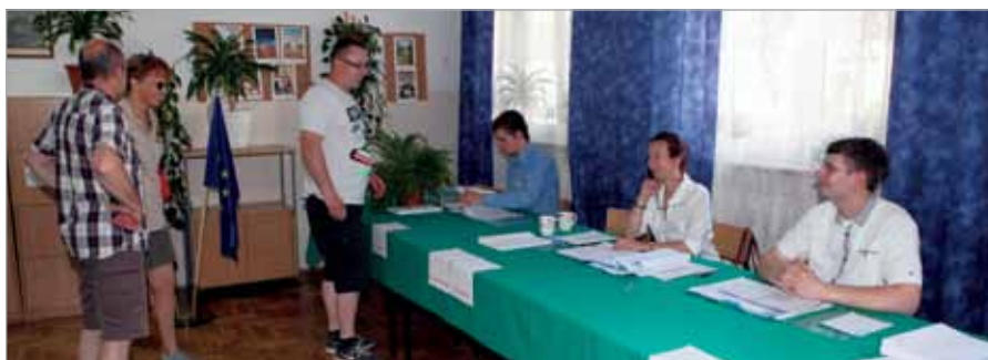
Mieszkańcy babickiej gminy podczas głosowania w Koczargach Starych

1) KW Platforma Obywatelska RP – 42,5%; 2) KW Prawo i Sprawiedliwość – 28,5%; 3) KW Nowa Prawica – Janusza Korwin-Mikke – 8,8%; 4) KKW Sojusz Lewicy Demokratycznej-Unia Pracy – 4,8%; 5) KKW Europa Plus Twój Ruch – 4,4%; 6) KW Polska Razem Jarosława Gowina – 3,9%; 7) KW Polskie Stronnictwo Ludowe – 2,5%; 8) KW Solidarna Polska Zbigniewa Ziobro – 2,4%; 9) KKW Ruch Narodowy – 1,7%; 10) KW Partia Zieloni – 0,5%