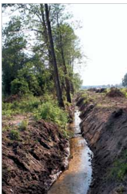
Odnowiony rów odwadniający w pobliżu ul. Pohulanka już odprowadza wodę

Gmina dziękuje wszystkim osobom, które zgodziły się na przejście instalacji odwadniających przez ich teren. Dzięki Państwu postawie i zrozumieniu możliwe jest przeprowadzenie potrzebnych inwestycji.