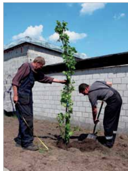
Coraz więcej ładnych roślin

Niestety tak to już jest, niezależnie od tego, czy zadanie dotyczy małej inwestycji, np. budowy 15 m chodnika, czy 1 km trotuaru – wymaga tej samej dokumentacji – precyzyjnych projektów i planów, a także pozwolenia na budowę.