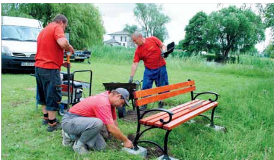
Montaż ławek w Zielonkach