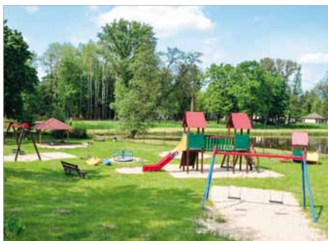
Plac zabaw w Lipkowie (przed kościołem, skrzyżowanie ulic Jakubowicza i Przy Parku) jest znów otwarty dla wszystkich mieszkańców