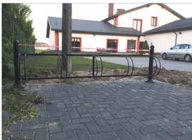
Oddano do użytku dla wszystkich mieszkańców stojak rowerowy przy przystanku autobusowym zlokalizowanym obok OSP Stare Babice (ul. Wieruchowska)