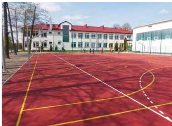
Oddano do użytku boisko oraz plac zabaw na terenie I Gminnego Gimnazjum w Koczargach Starych (dostępne dla wszystkich mieszkańców po zakończeniu zajęć lekcyjnych w szkole)