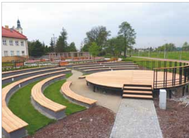
Wymieniono deski w amfiteatrze oraz na scenie w parku babickim (naprawa w ramach gwarancji)