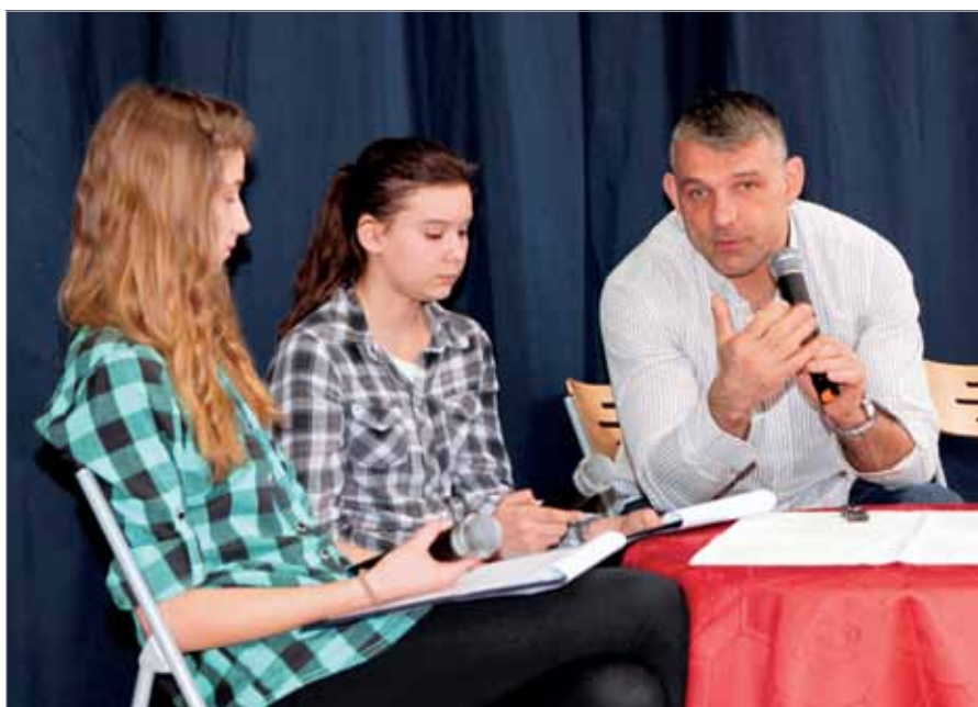
Mistrz Paweł Nastula udzielił wywiadu uczennicom z Borzęcina

– Najtrudniejsze boje toczyłem z Brazylijczykiem, z którym walczyłem zarówno w finale Mistrzostw Świata, jak i o wejście do finału na Olimpiadzie w Atlancie.