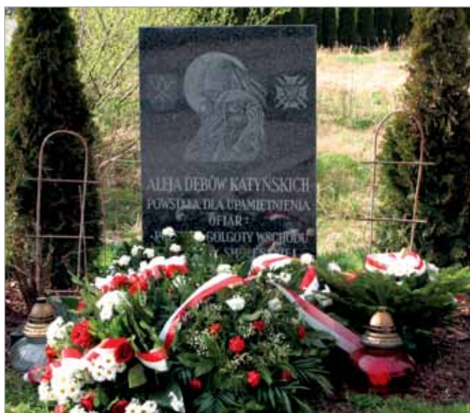
Przed tablicą Matki Bożej Katyńskiej złożono wieńce i kwiaty