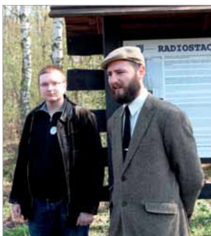
O Radiostacji opowiadali przedstawiciele Stowarzyszenia „Park Kulturowy Radiostacja Babice”

Dziękujemy wszystkim nauczycielom i opiekunom grup, którzy prowadzili uczniów na rajdowych szlakach, dziękujemy również wspaniałym rodzicom dzieci z przedszkola w Bliznem, któ-