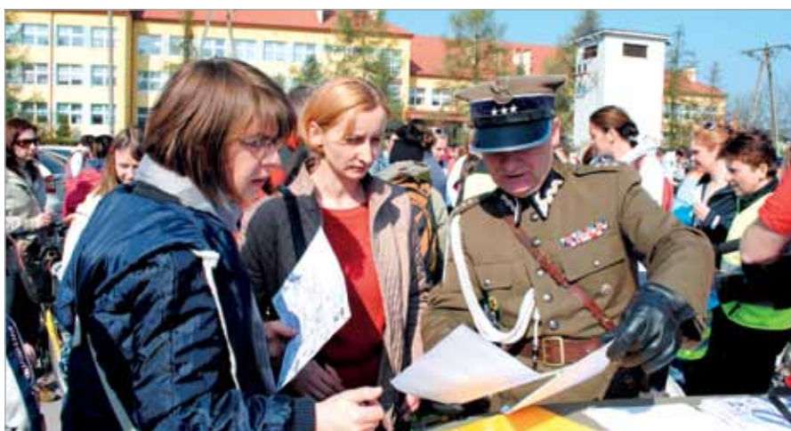
Trasa tegorocznego rajdu obejmowała 8 punktów. Wszystkie zaznaczono na specjalnych mapach

Dziękujemy wszystkim nauczycielom i opiekunom grup, którzy prowadzili uczniów na rajdowych szlakach, dziękujemy również wspaniałym rodzicom dzieci z przedszkola w Bliznem, któ-