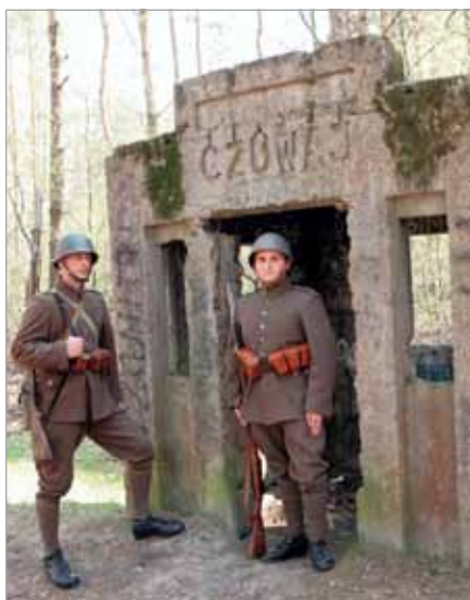
Przy budkach wartowniczych Radiostacji Babice...