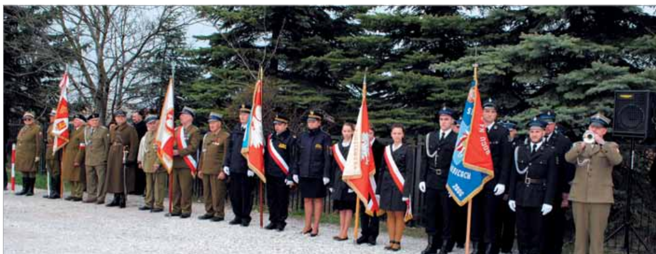
Poczty sztandarowe w babickiej Alei Dębów Katyńskich