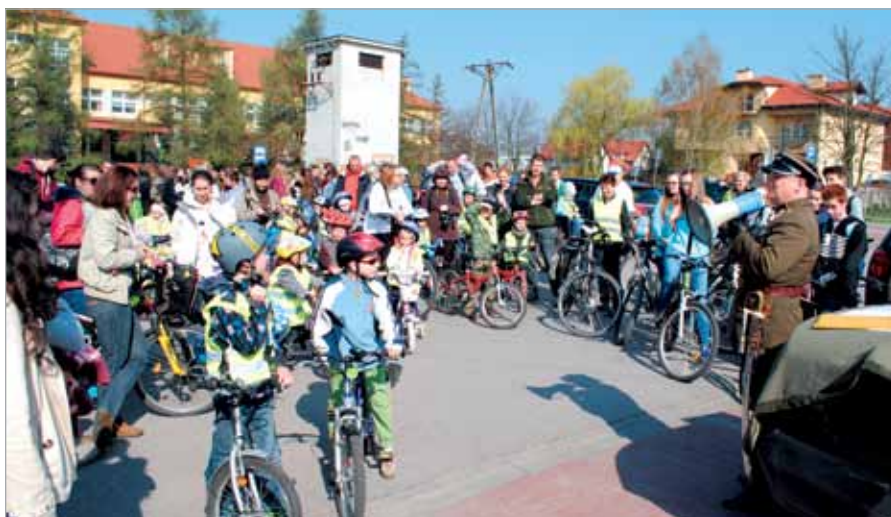
Powitanie uczestników rajdu przed szkołą podstawową w Starych Babicach