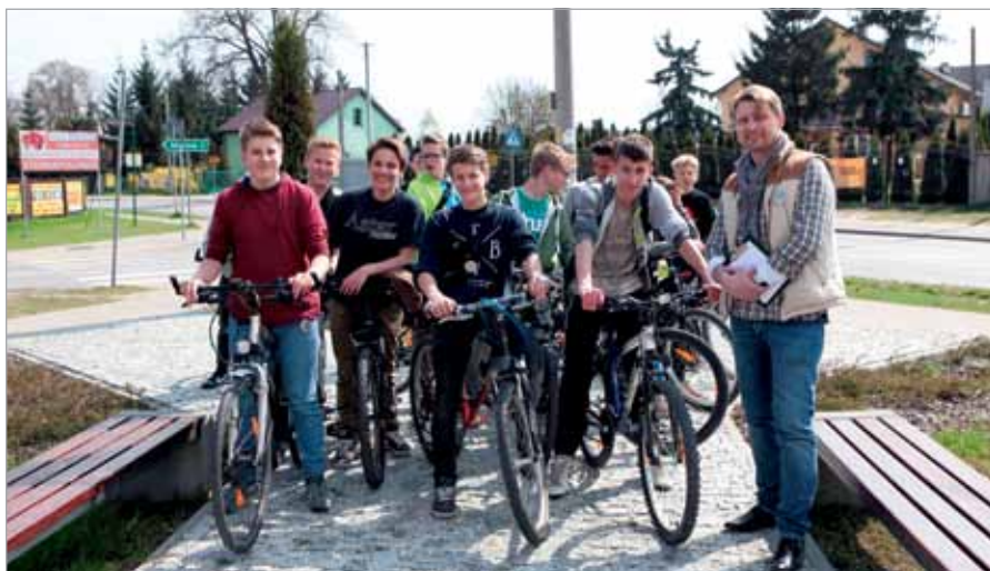
Rajdowicze przy Miejscu Pamięci Narodowej w Borzęcinie Dużym