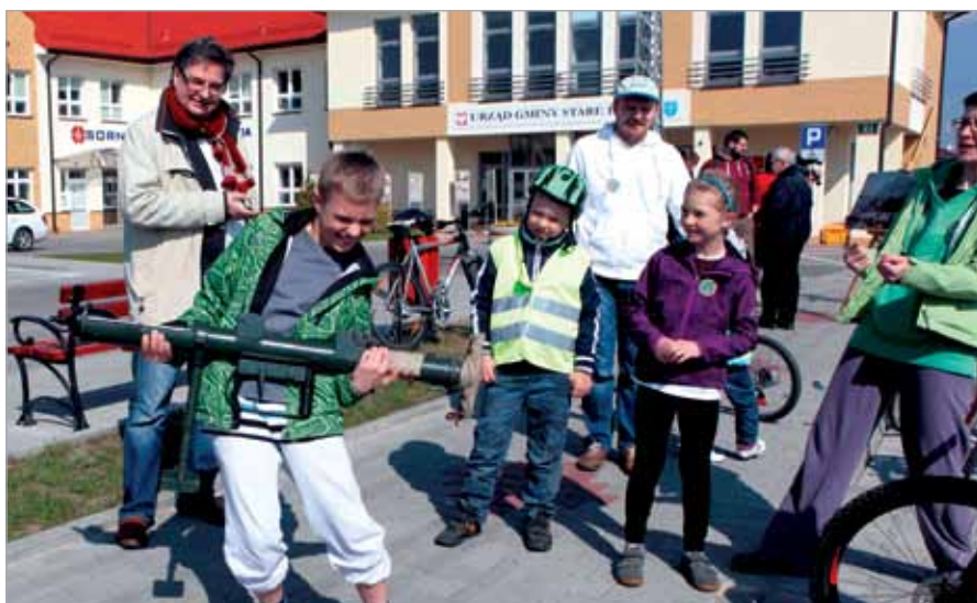
Replika PIAT-a wzbudzała duże zainteresowanie najmłodszych