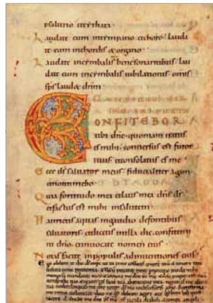
Modlitwa Gertrudy jako nota marginalna

nad Modlitewnikiem Gertrudy i zarazem stało się powodem wielu krytyk. Zostało uznane za bardzo niedokładne. Dopiero ostatnie piętnastolecie przyniosło niezwykle zainteresowanie Kodeksem Gertrudy, co zaowocowało wieloma opracowaniami na ten temat i powrót do, jak się okazuje, poprawnego opracowa-