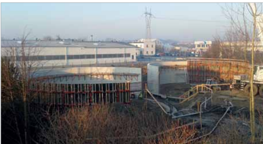
Osadniki wtórne w realizacji, Oczyszczalnia Ścieków

O dalszym postępie prac i ewentualnych problemach realizacyjnych będziemy Państwa informowali w kolejnych artykułach zamieszczonych na łamach „Gazety Babickiej” i na naszej stronie internetowej.