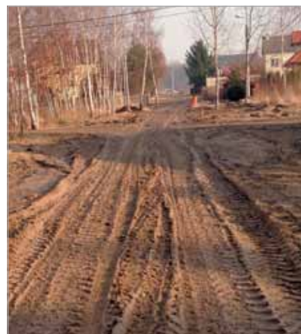
Ulica Krzyżanowskiego w trakcie prac budowlanych

w nim koleiny, brak kładek dla przechodniów – tak wyglądają prace. Co gmina i Eko Babice robią w tej sprawie?