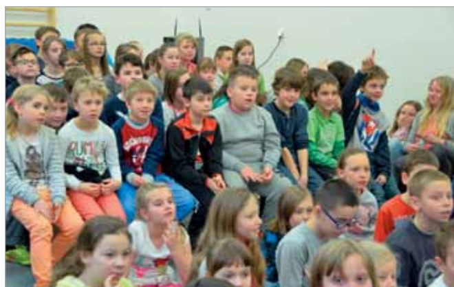
Zastuchani sycylijskimi opowieściami uczniowie borzęcińskiej podstawówki