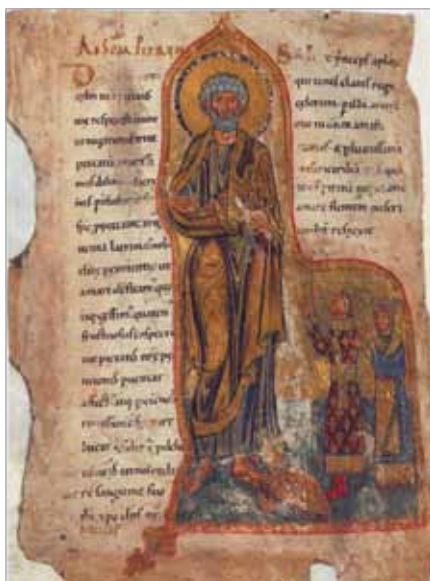
Gertruda u stóp Św. Piotra

nad Modlitewnikiem Gertrudy i zarazem stało się powodem wielu krytyk. Zostało uznane za bardzo niedokładne. Dopiero ostatnie piętnastolecie przyniosło niezwykle zainteresowanie Kodeksem Gertrudy, co zaowocowało wieloma opracowaniami na ten temat i powrót do, jak się okazuje, poprawnego opracowa-