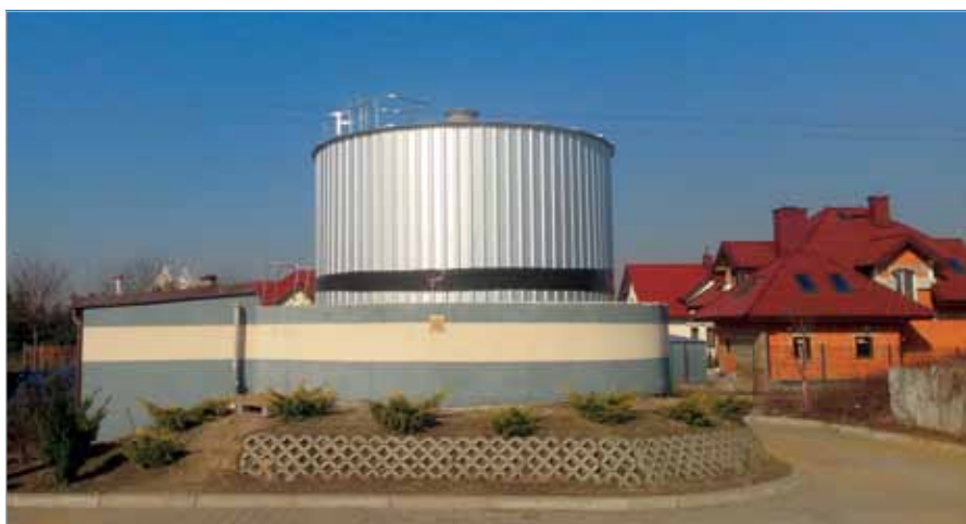
Zbiornik reakcji w realizacji, Stacja Uzdadniania Wody

Prace nad realizacją tego zadania jeszcze trwają a Wykonawca nie ustrzegł