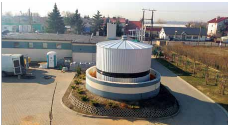
Zbiornik reakcji w realizacji, Stacja Uzdatniania Wody

Aktualny harmonogram prac jest zamieszczony na naszej stronie internetowej, w zakładce JRP – Harmonogram, a w podzakładkach znajdują się dokładniejsze informacje na temat każdego z zadań już realizowanych.