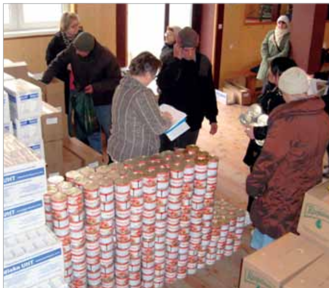
Do naszej gminy trafiło ok. 4 ton żywności