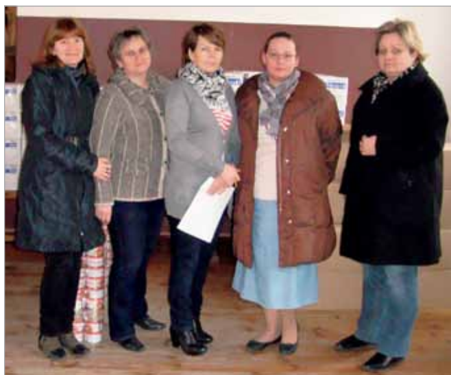
Akcję pomocy żywnościowej koordynowały Panie z babickiego GOPS