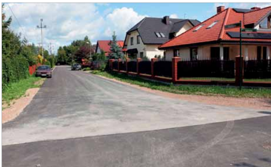
Nowe nawierzchnie na ul. Kalinowej i Świerkowej

Ulica Kosmowska zostanie przebudowana na długości ok. 2200 m, od ul. Warszawskiej do granicy gminy. Przewiduje się wykonanie tej inwestycji w drugiej połowie br., a budowę chodnika i zjazdów po uzyskaniu własności przez Powiat.