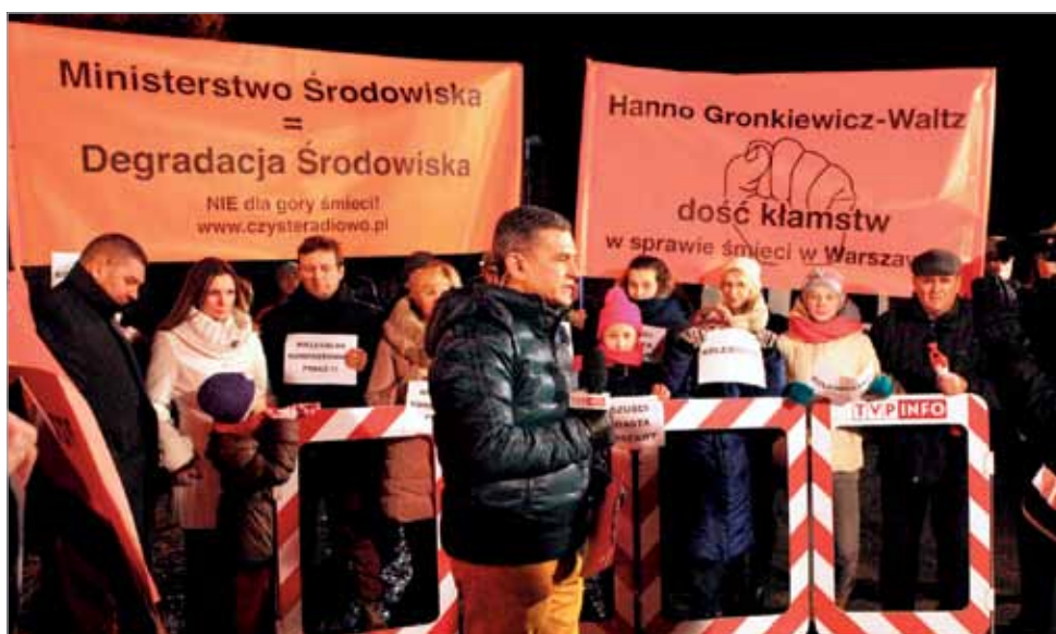
Relacja z protestu w TVP Info

do władz naszej gminy, które w oczywisty sposób nie mają mocy decyzyjnej w stolicy. Monity skierowano zatem do władz Warszawy i Zarządu MPO, które powinny rozwiązać jak najszybciej zaistniały problem.