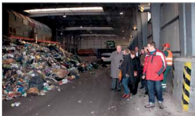
Delegacja podczas zwiedzania zakładu