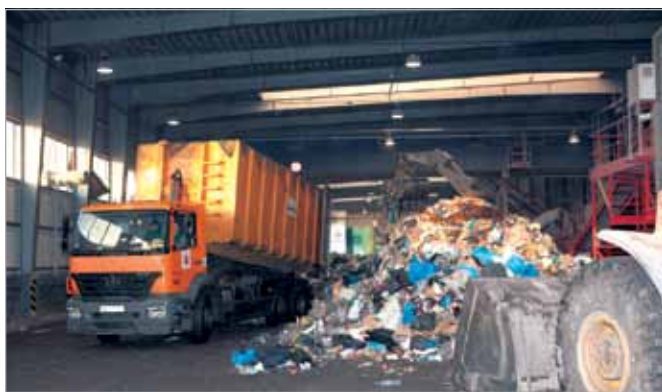
Sortowanie i przetwórstwo odpadów odbywa się w zamkniętych halach