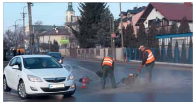
Dobra pogoda umożliwia również remonty nawierzchni dróg. Na zdjęciu remonty cząstkowe nawierzchni w Starych Babicach