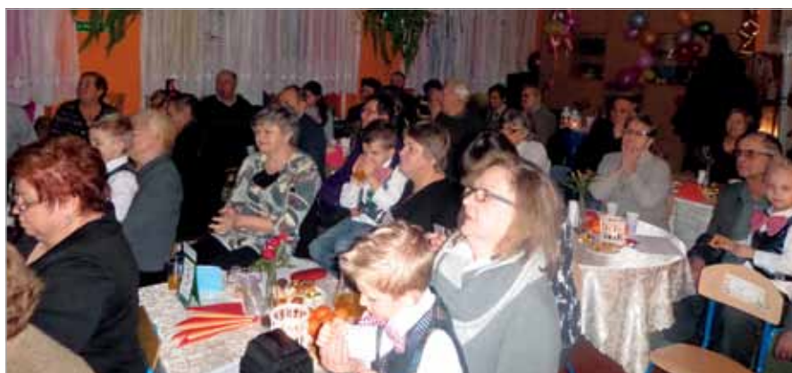
Seniorzy z zaciekawieniem oglądali występy najmłodszych babcizan