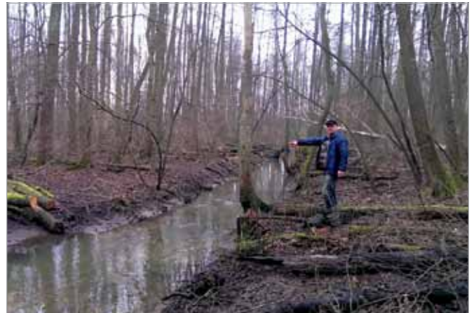
Kanał Zaborowski został oczyszczony z pni drzew i śmieci

Kanał ma bardzo duże znaczenie dla babickiej gminy, spływa do niego ¼ wód opadowych z naszego terenu. Od jego przepustowości zależy zatem, czy będziemy podtapiani, czy nie. Gmina podjęła się przeprowadzenia niezbędnych prac. Uzgodniono wszelkie