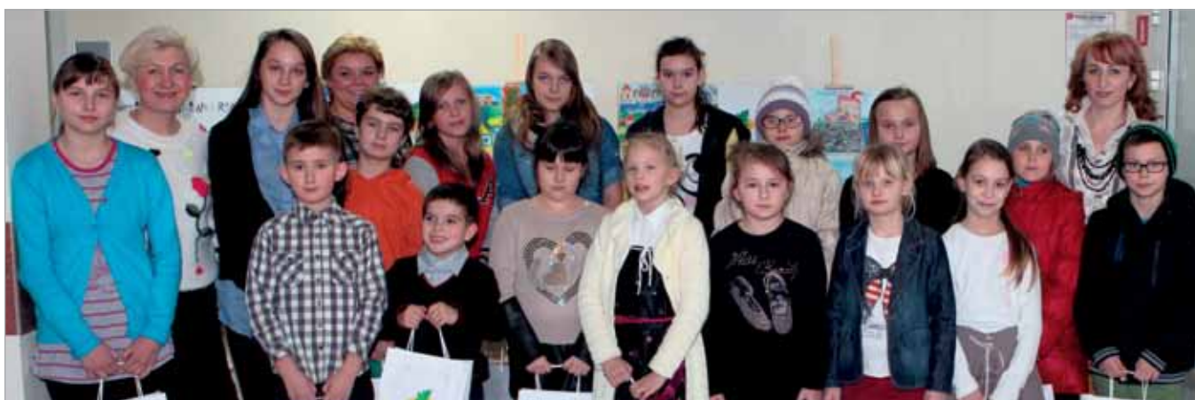
Uczniowie wyróżnieni w konkursie z nauczycielkami i Dyrektorką ZSP w Borzęcinie Dużym