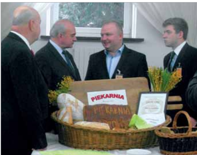
Laureat nagrody (pośrodku) z ministrem rolnictwa i rozwoju wsi Stanisławem Kalembą (drugi od lewej)

„Szlak podróży smakoszy pieczywa pszennego powinien prowadzić przez Stare Babice, bowiem z tej miejscowości, z Piekarni »Dąbrowscy« pochodzi przepyszna bułka paryska” – napisano w artykule Szlakiem smakowitego chleba opublikowanym w „Przeglądzie Piekarskim i Cukierniczym”. Organizatorem VII Ogólnopolskiego Konkursu Pieczywa było Stowarzyszenie Naukowo-Techniczne Inżynierów i Techników Przemysłu Spożywczego.