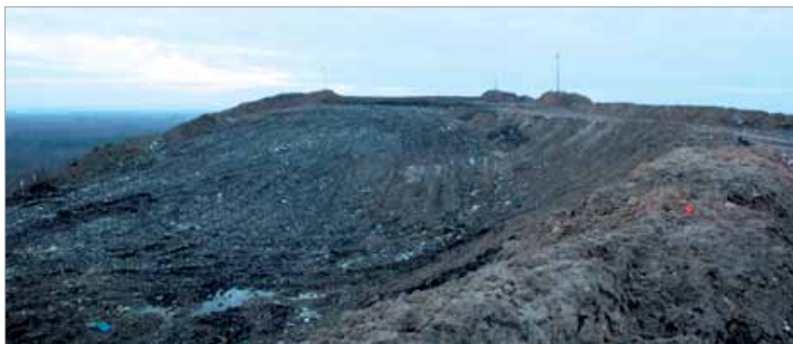
Na wzgórzu widać już zarysy przyszłego stoku narciarskiego