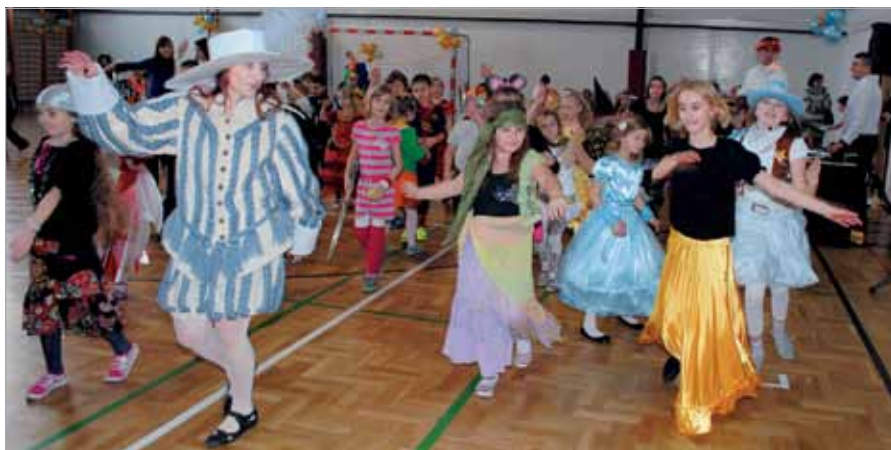
Pani Wicedyrektor – mistrz ceremonii, zachęcamy innych do naśladowania

EWA CZAJCZYŃSKA-MASTALERZ, JOLANTA GOŁĘBIEWSKA