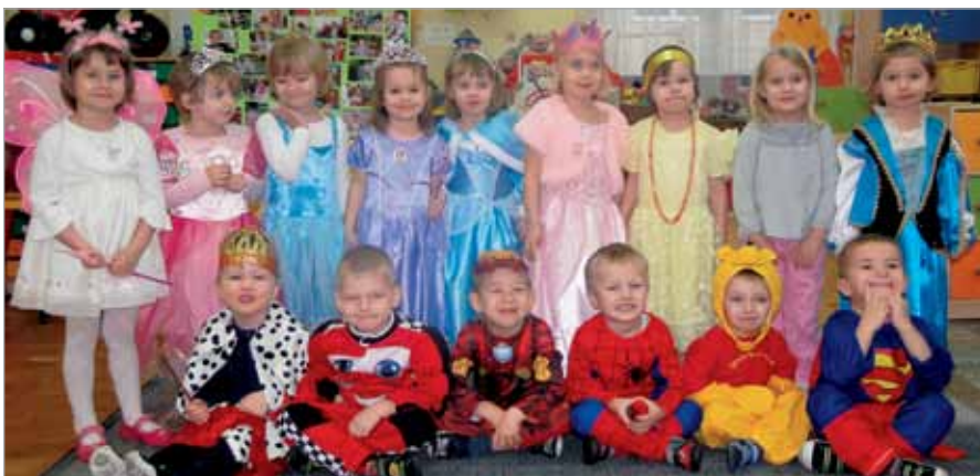
Po balu w Babicach pamiątkowe zdjęcie

Dzieci uczestniczyły w wielu zabawach i konkursach. W programie nie zabrakło również wymyślnych tańców i piosenek do największych przebojów tego roku.