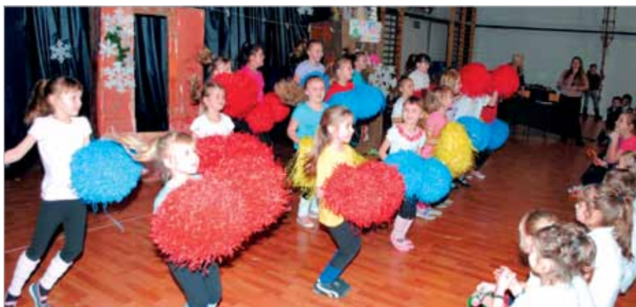
Dzieci przygotowały program artystyczny dla seniorów

Odświętnie ubrane maluchy zaśpiewały radosne piosenki. Rozbrzmiewała „Karuzela, karuzela na Bielanych co niedziela”, przypominając Dostojnym Gościom ich młodszeń-