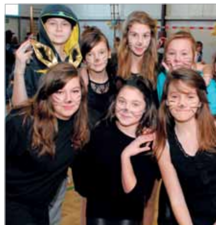
Kociaki z Borzęcina