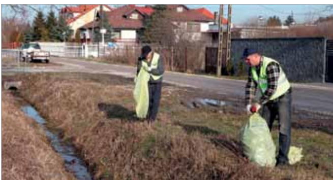
W ostatnim czasie przeprowadzono wiele prac porządkowych wzdłuż rowów i ulic. Na zdjęciu prace w okolicy ul. Sienkiewicza