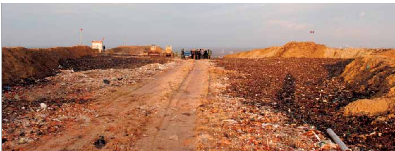
Na szczycie wzgórza w Mościskach