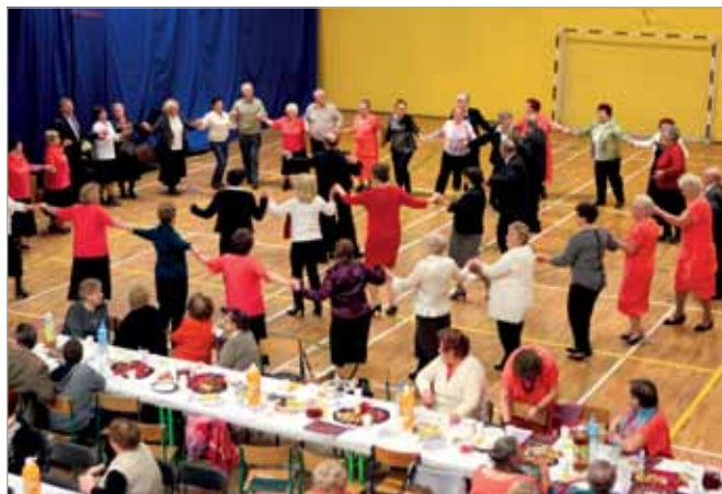
Podczas spotkania nie zabrakło również tańców