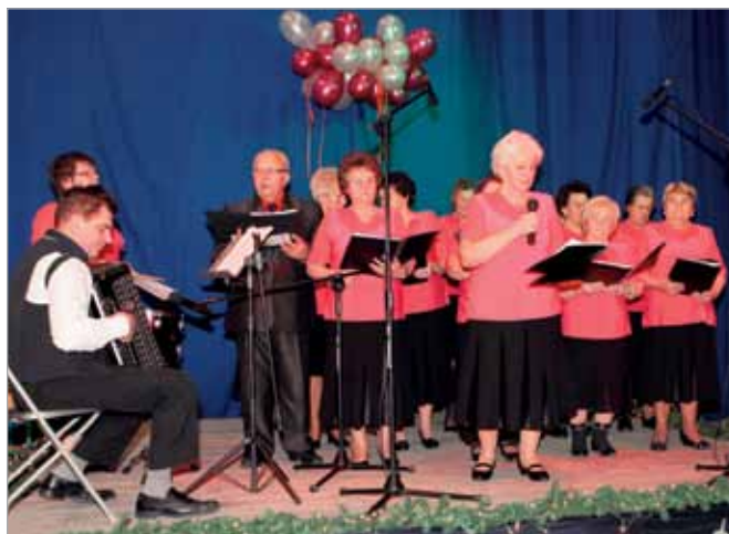
„Sami Swoi” z Borzęcina Dużego