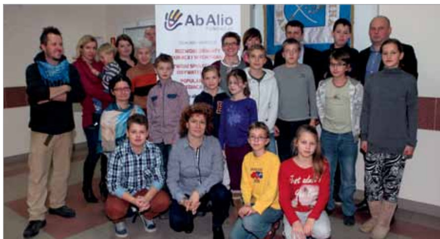
Uczestnicy i sympatycy projektu „Kultura musi tutaj być!”

2014 roku odbywały się warsztaty filmowe dla młodzieży z naszego terenu i bezpłatne projekcje filmów w babickim Urzędzie Gminy.