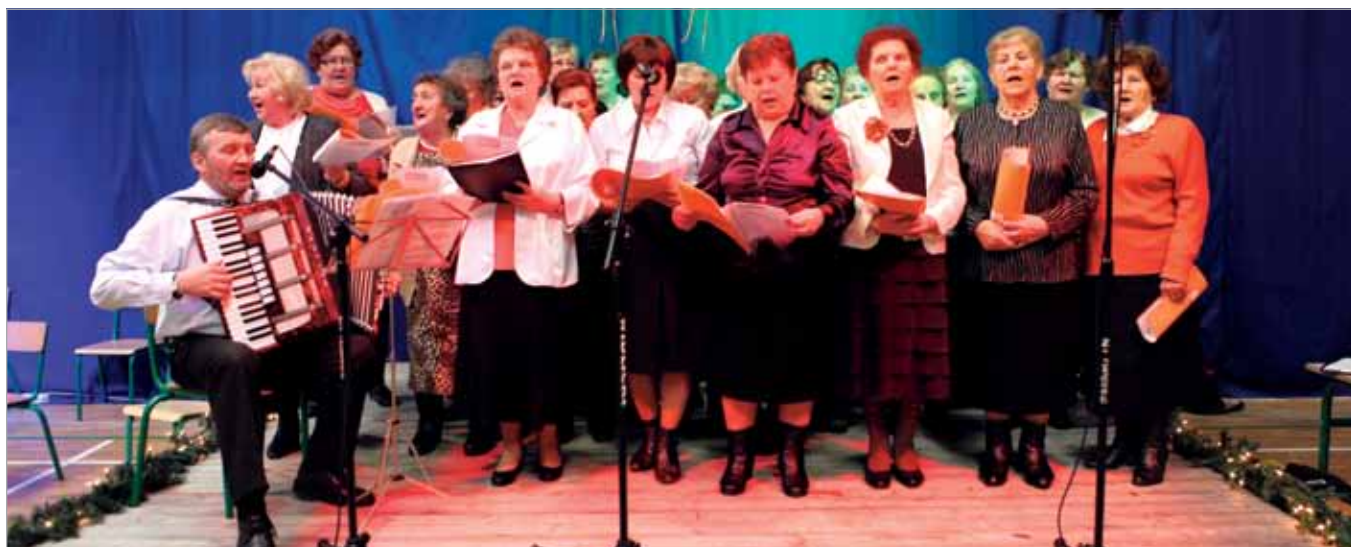
Klub Seniora „Nadzieja” także potrafi zaśpiewać