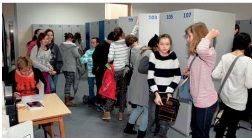
Nowa szatnia w Zespole Szkolno-Przedszkolnym