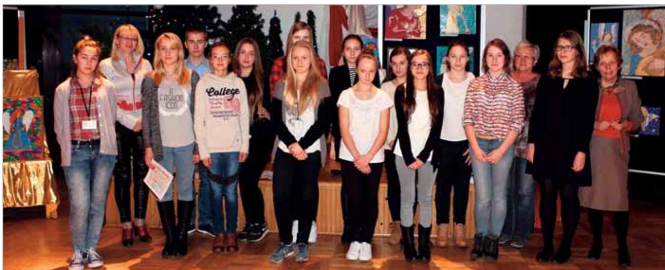
Laureaci 10. Jubileuszowego Konkursu Plastycznego