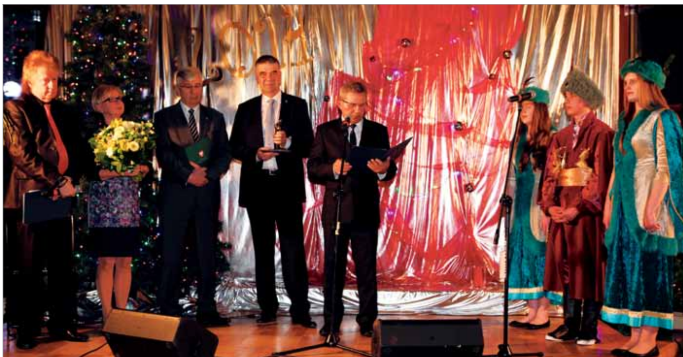
Laureat Babinicza za rok 2014 podziękował za wyróżnienie

– Jeden człowiek może niewiele, ale gdy jest nas więcej, możemy dokonać wielkich rzeczy! – podkreślił. – Podejmując pracę społeczną, nie myślałem nigdy o nagrodach ani o fotografowaniu się w pierwszym rzędzie, działałem zawsze z potrzeby serca. Po