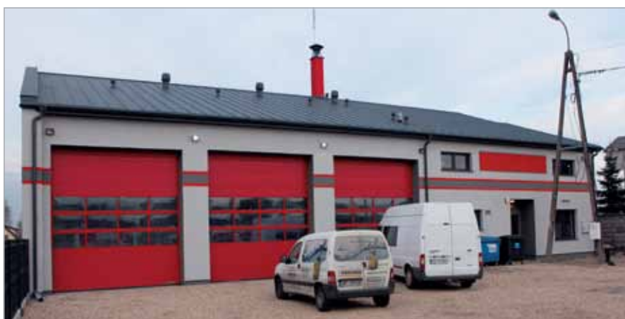
Remiza OSP w Borzęcinie Dużym