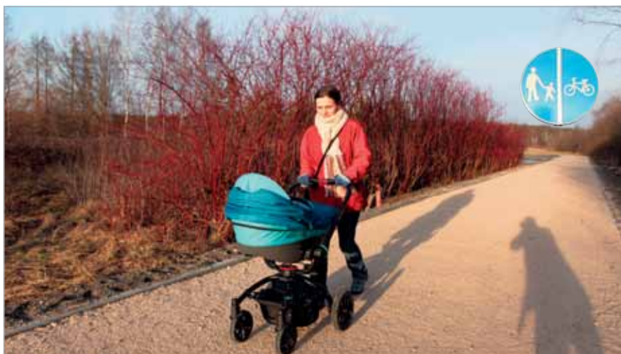
Ciąg pieszo-rowerowy Kludyn-Janów