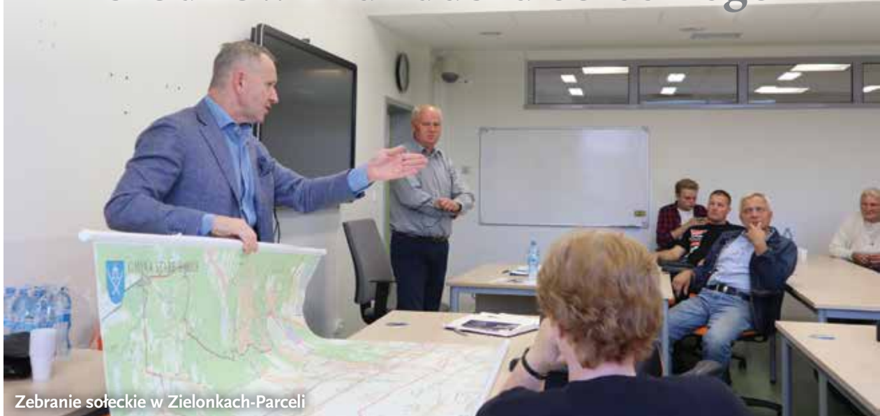
Zebranie sołeckie w Zielonkach-Parceli