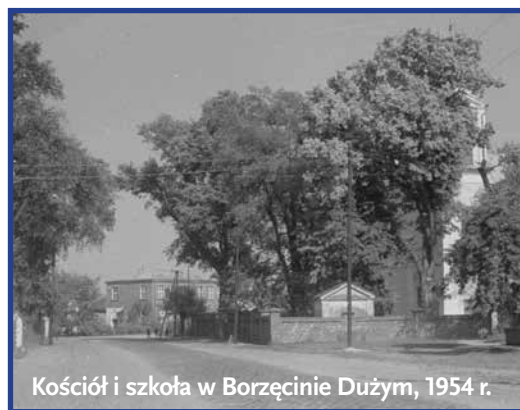
Kościół i szkoła w Borzęcinie Dużym, 1954 r.

Niezwykła historia wydarzyła się w styczniu 2012 roku, kiedy to mój kolega kupił w Internecie oryginalną gazetę ze stycznia 1912 roku. Znaleźć w niej można było opis i zdjęcia potwornej zbrodni dokonanej w Borzęcinie pod Ożarowem, o której nikt wcześniej nie słyszał. Ciekawostką jest fakt, że zakupu gazety dokonał dokładnie 100 lat po opisanych wydarzeniach. Kiedy kurier dostarczył przesyłkę patrzyliśmy na pismo tak, jakbyśmy znaleźli wielki skarb.