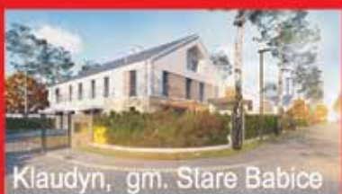
Klaudyn, gm. Stare Babice