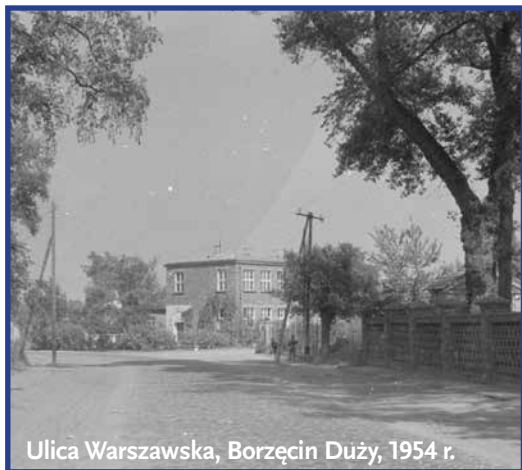
Ulica Warszawska, Borzęcin Duży, 1954 r.

Pomysł na wystawę pn. „Borzęcin na dawnej fotografii” kielkował od wielu lat. Tak naprawdę jest to praca zbiorowa, gdyż swoje zdjęcia dostarczyły Ochotnicza Straż Pożarna i Szkoła w Borzęcinie, fotografie uzyskaliśmy także od naszych mieszkańców.