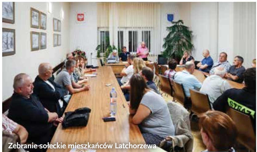
Zebranie sołeckie mieszkańców Latchorzewa

Wnioski, które zostaną przekazane wójtowi zostaną zweryfikowane pod kątem prawidłowości formalno-prawnych. Pozytywnie ocenione dokumenty zostaną przekazane do Rady Gminy, która będzie je dalej