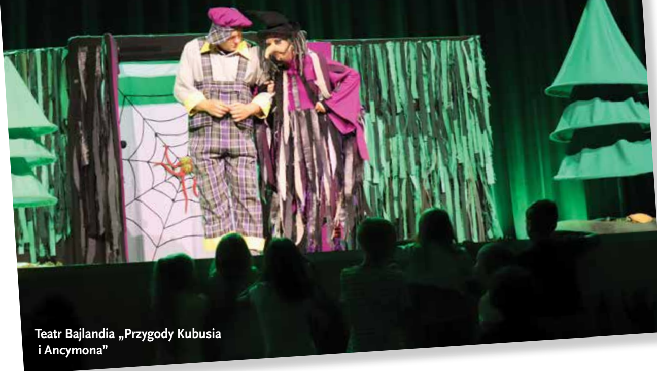
Teatr Bajlandia „Przygody Kubusia i Ancymona”