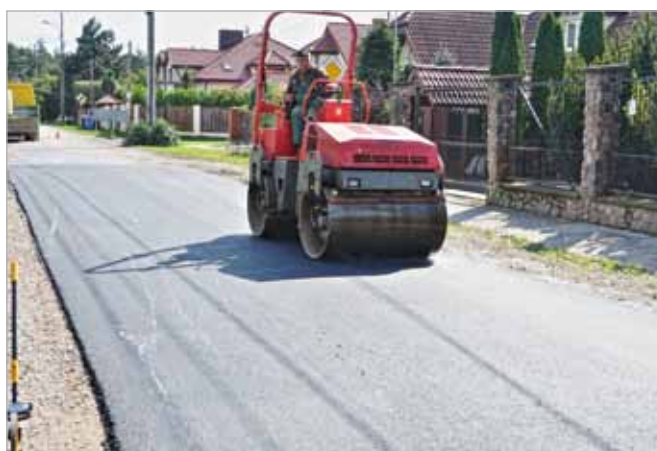
Wykonano prace drogowe przy ul. Maczka w Kwirynowie