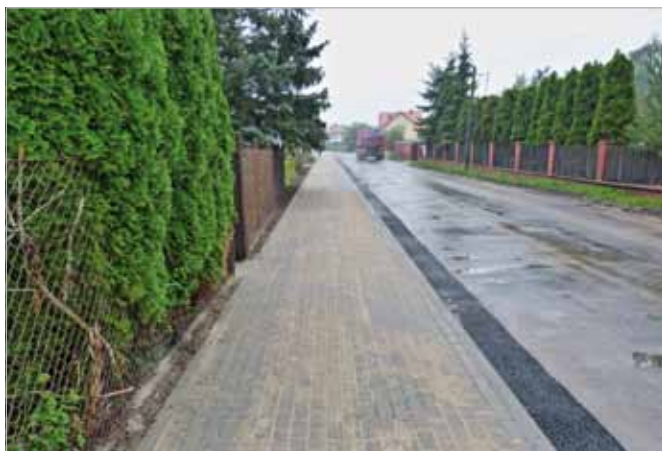
Wybudowano chodnik przy ul. Wspólnej w Wojcieszynie