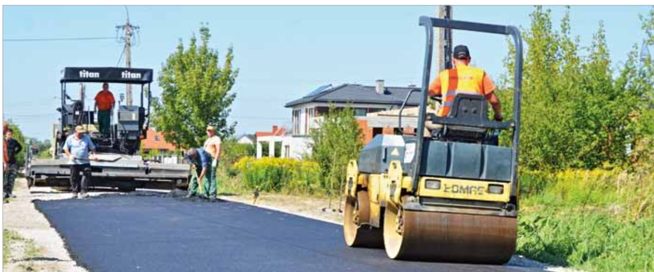
Wykonano nakładkę asfaltową przy ul. Koczarskiej w Starych Babicach