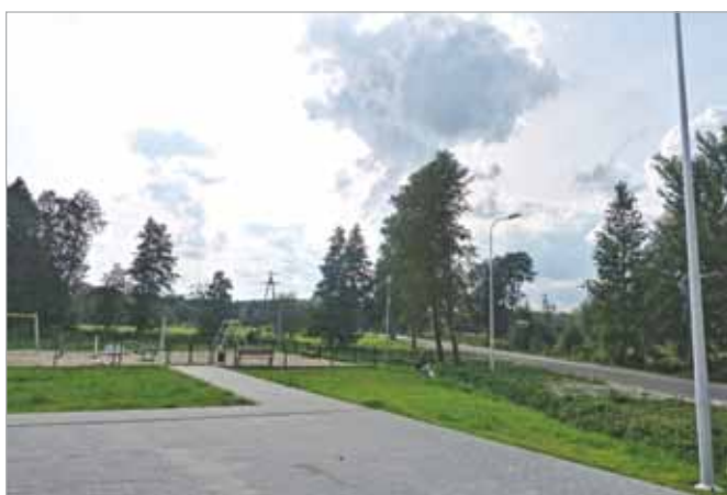
Wykonano oświetlenie w Mariewie, m.in. przy placu zabaw przy ul. Kwiatowej/ róg Wólczyńskiej