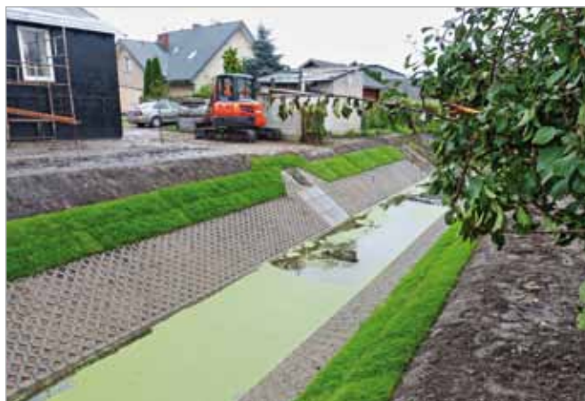
Wykonano odwodnienie przy ul. Trakt Królewski w Wierzbinie/ Zalesiu