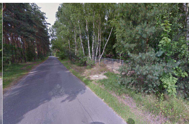
Fot. 3. Tereny otwarte w ciągu ul. Białej Góry

Obszar Planu, ze względu na dogodne połączenie komunikacyjne, poprzez ul. Białej Góry z ul. Warszawską (droga wojewódzka nr 580 relacji Warszawa - Leszno - Sochaczew), stanowi bardzo atrakcyjny teren inwestycyjny i aktualnie podlega silnemu procesowi inwestycyjnemu. Jednocześnie, droga wojewódzka ze względu na odległość ok. 1,3km nie stanowi źródła uciążliwości akustycznej dla terenu objętego opracowaniem.