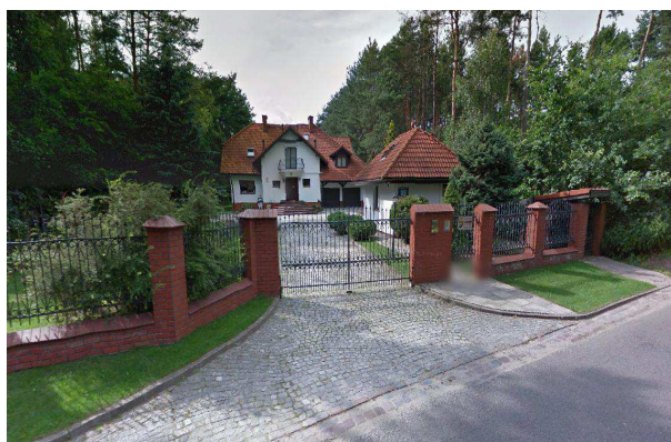
Fot.2. Zabudowa mieszkaniowa przy ul. Białej Góry