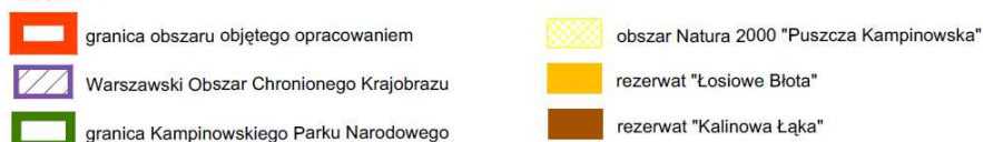
Ryc.3. Usytuowanie terenu opracowania względem obszarów chronionych