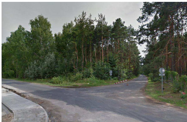
Fot..1. Skrzyżowanie ul. Sienkiewicza i Białej Góry