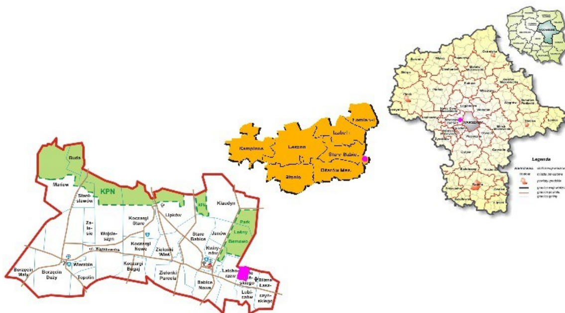
Ryc. 2. Orientacyjna lokalizacja terenu opracowania

Obszar objęty projektem miejscowego planu zagospodarowania przestrzennego położony jest w województwie mazowieckim, w powiecie warszawskim zachodnim, we wschodniej części gminy Stare Babice. Obejmuje zachodni fragment wsi Blizne Jasińskiego. Powierzchnia terenu wynosi 4,4 ha.