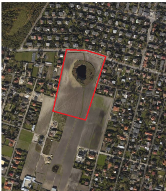
Ryc. 3 Zdjęcie lotnicze z naniesioną granicą opracowania.