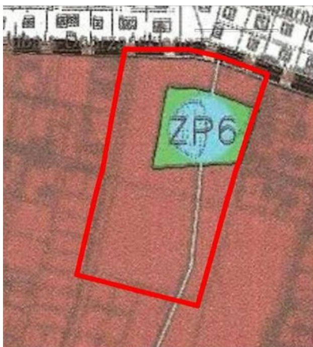
Ryc. 1. Wycinek z rysunku Studium Uwarunkowań i Kierunków Zagospodarowania Przestrzennego gminy Stare Babice dla Planu obejmującego fragment wsi Blizne Jasińskiego.

Zgodnie ze Studium (Ryc.1), wiodącym kierunkiem zagospodarowania w granicach opracowania są obszary skupionego osadnictwa mieszkaniowego jednorodzinnego MN1.