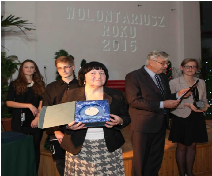
Wolontariusz Roku 2015