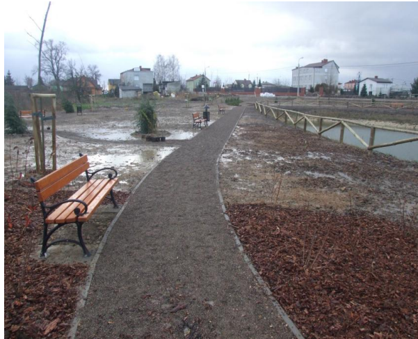
Staw i skwer w Borzęcinie