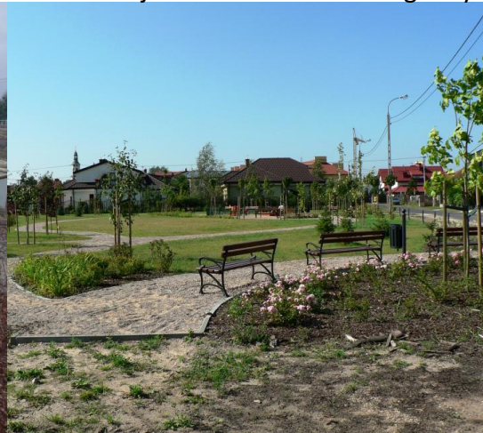
Plac w Kwirynowie