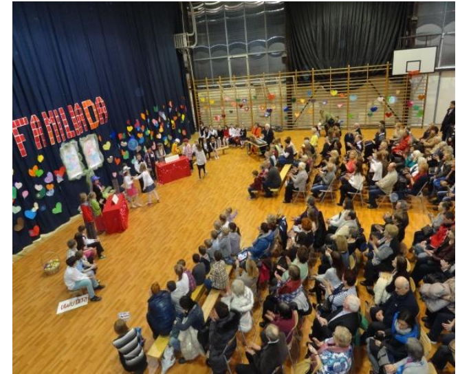
Dzień Babci i Dziadka

http://www.stare-babice.pl/pl/page/starobabicki-uniwersytet-iii-wieku