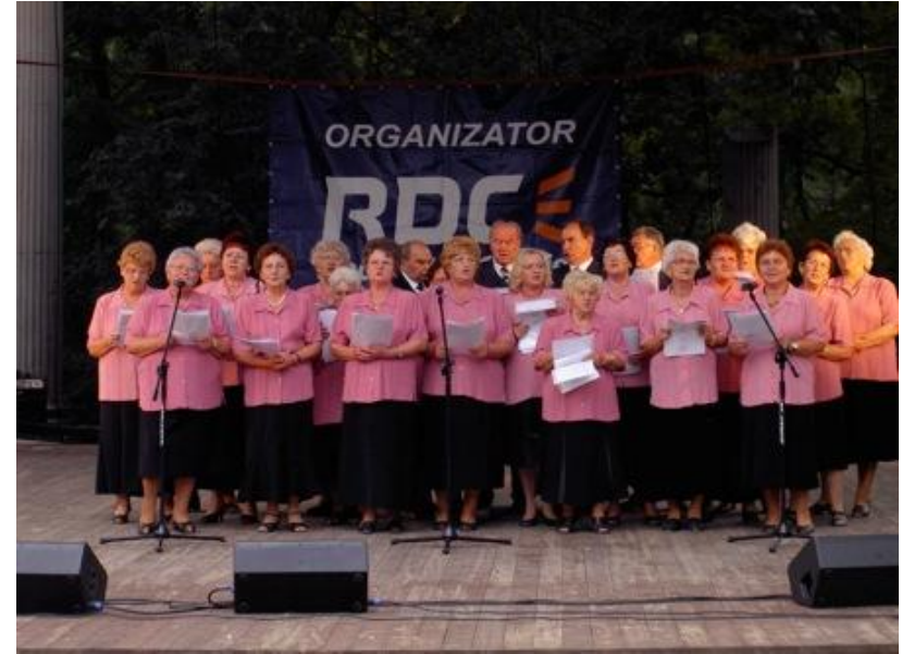
Chór "Sami Swoi" działa w ramach Stowarzyszenia Kotwica