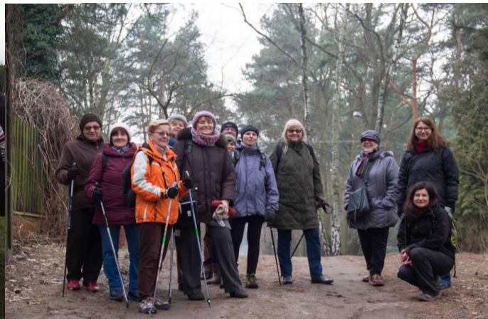
Zajęcia nordic walking