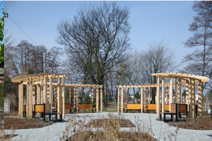
Park w Starych Babcach