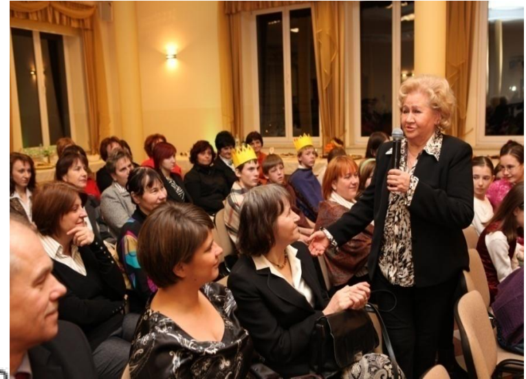
Wolontariusz Roku 2014