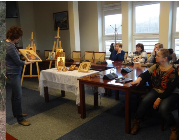
Spotkanie z autorką ikon